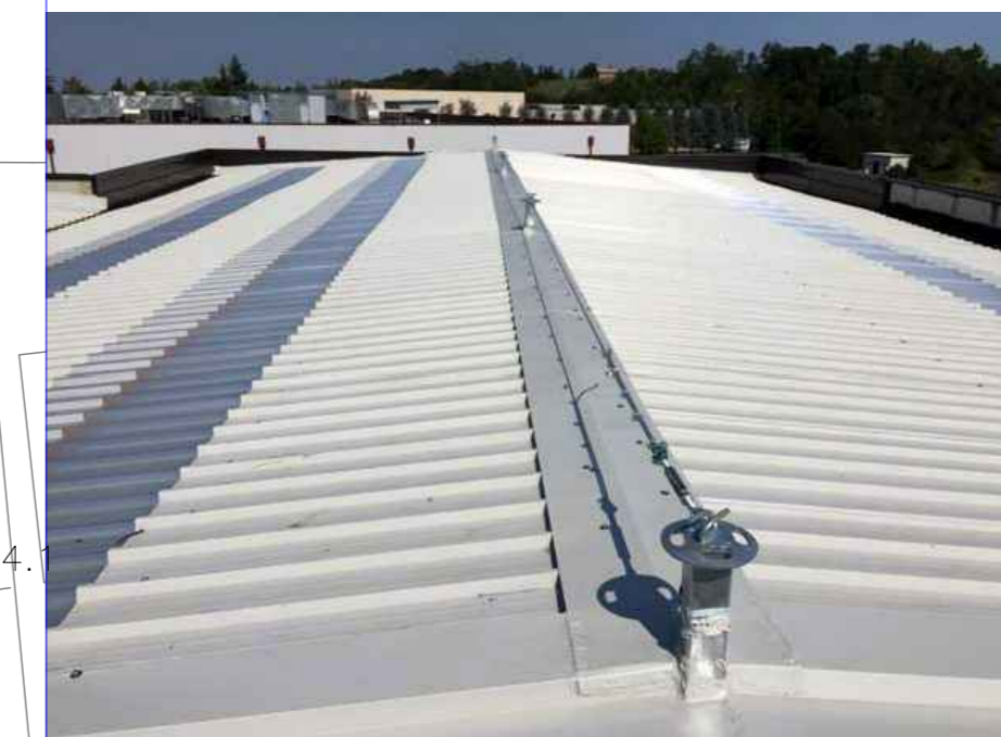
PARTICOLARI LINEE VITA TIPOLOGIE