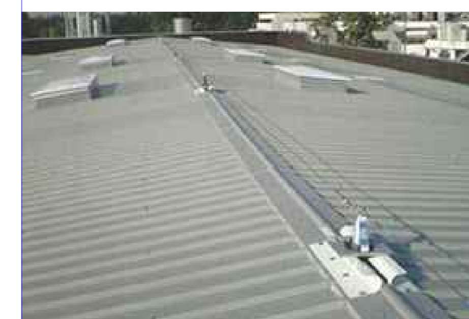
PARTICOLARI LINEE VITA TIPOLOGIE