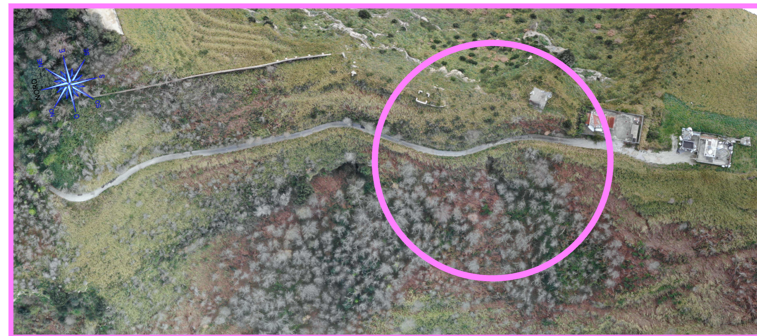
Probabili frane da rotolamento