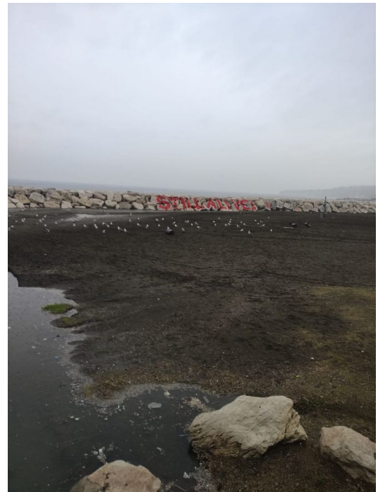
STATO DEL LUOGHI