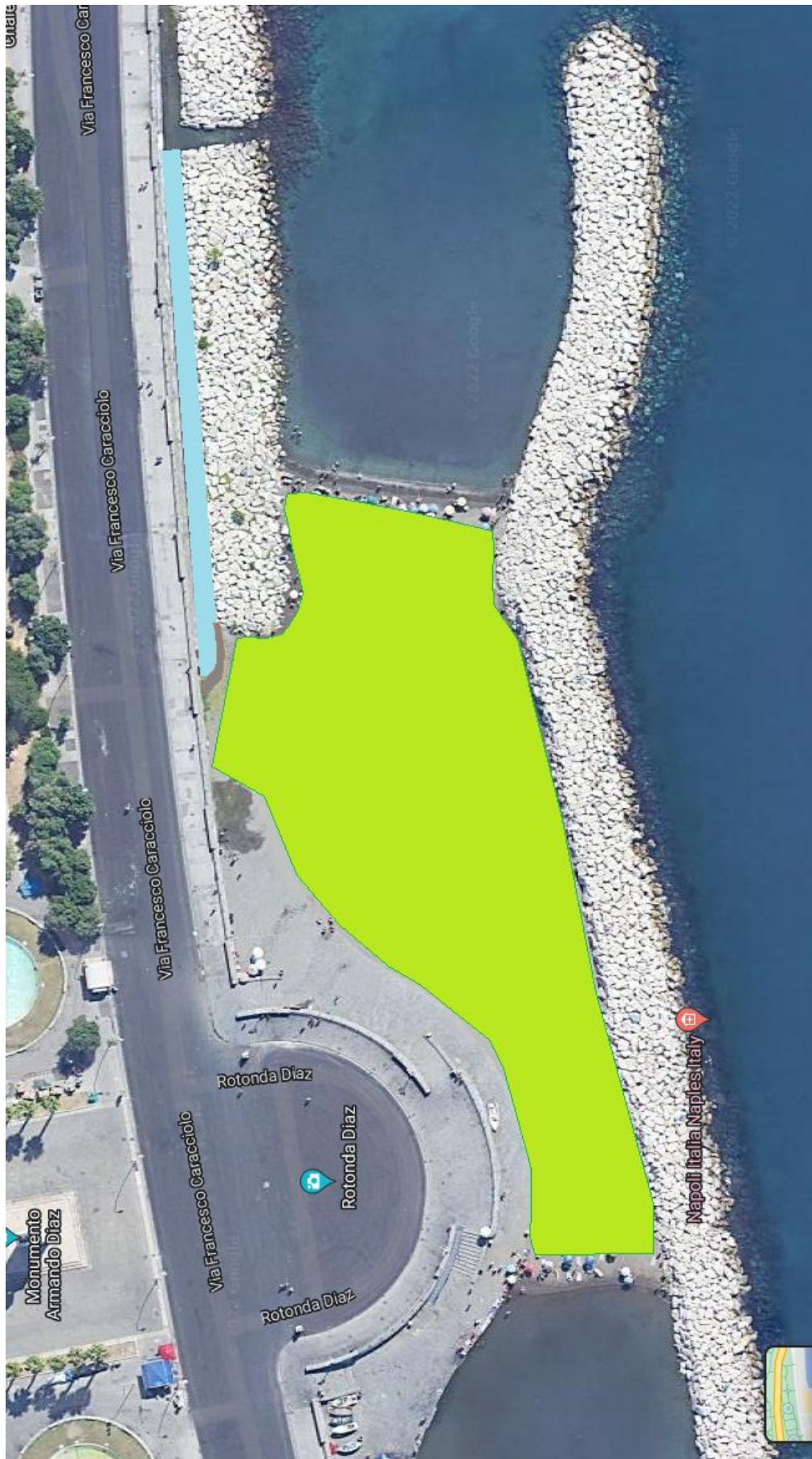
SCHEMA DELLE AREE DI INTERVENTO