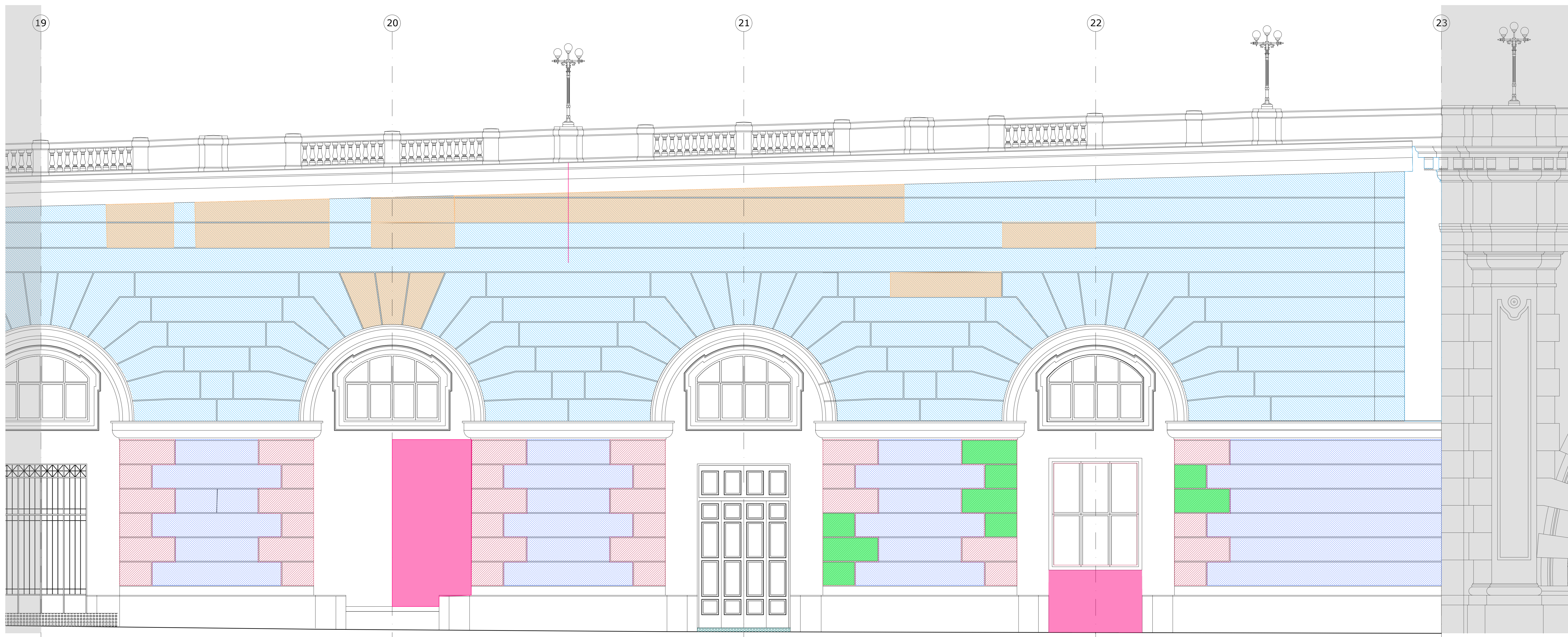
PROSPETTO ASSI 19 - 23