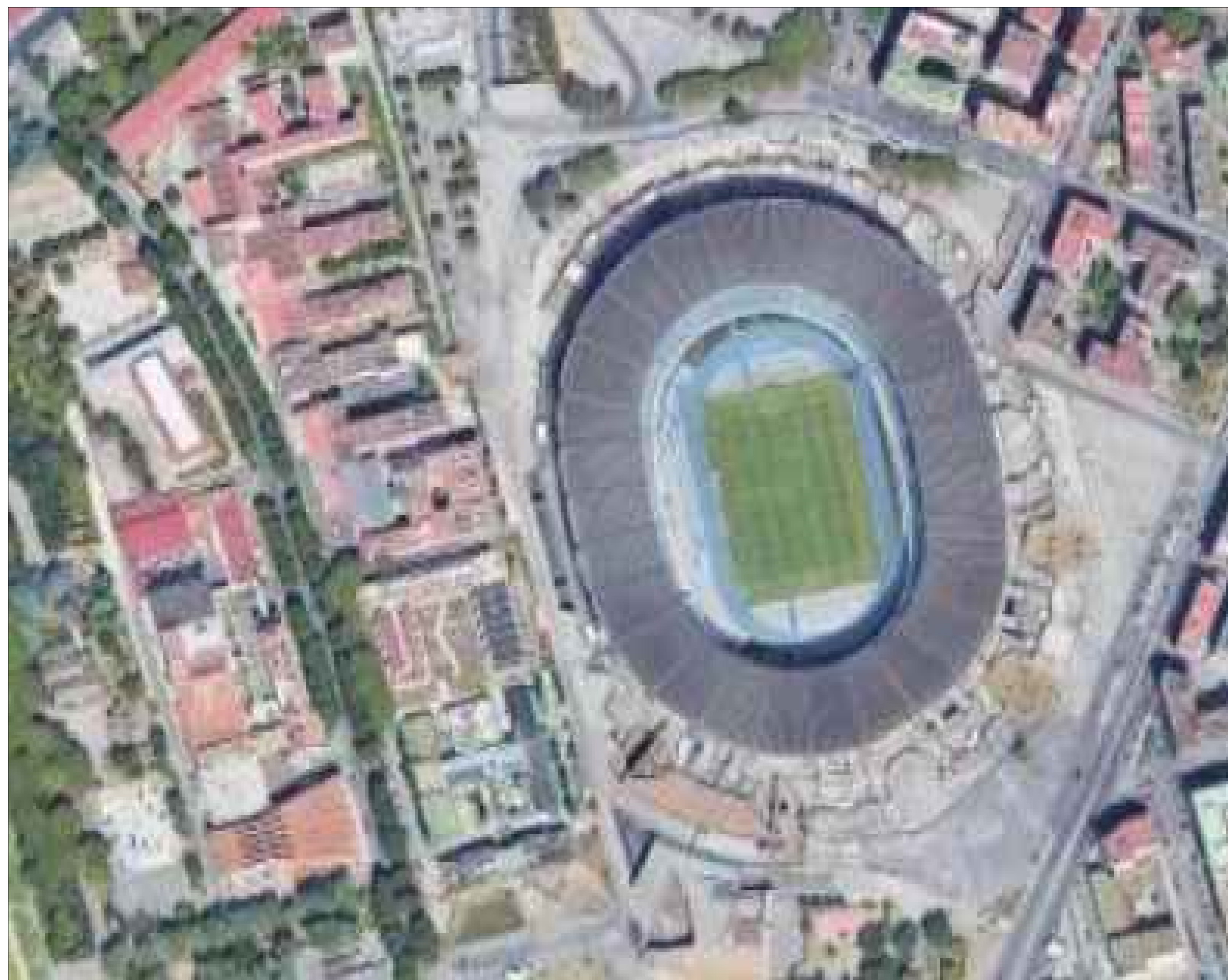
STRALCIO ORTOFOTO - Scala 1:1000