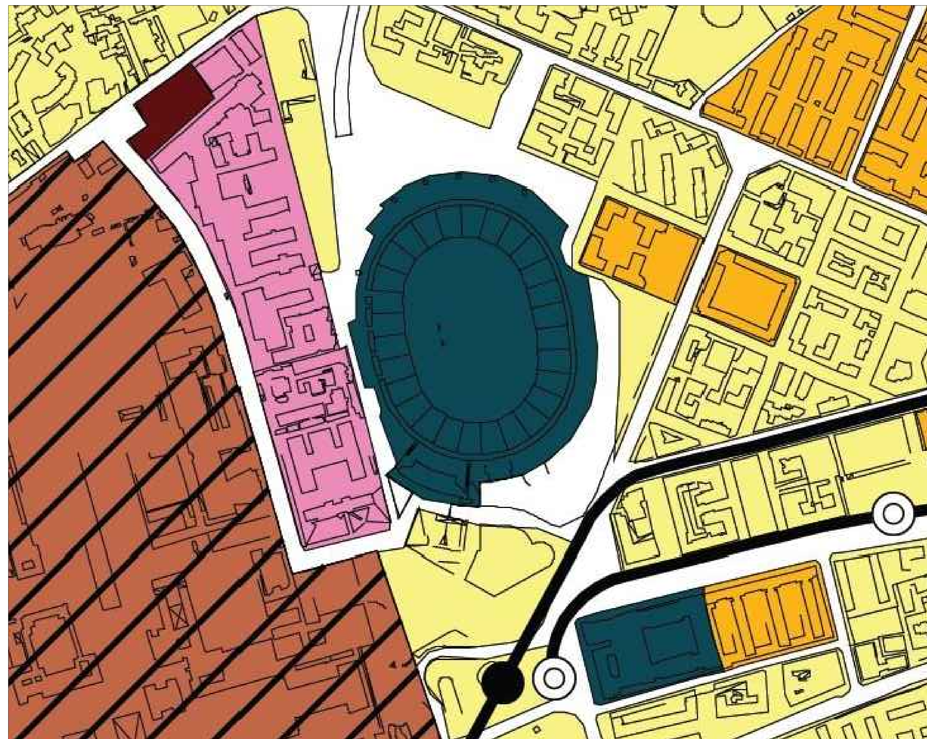
STRALCIO PIANO REGOLATORE GENERALE - Scala 1:2000