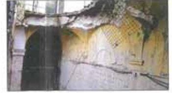
VISTA DAL BASSO DELLE VOLTE CROLLATE