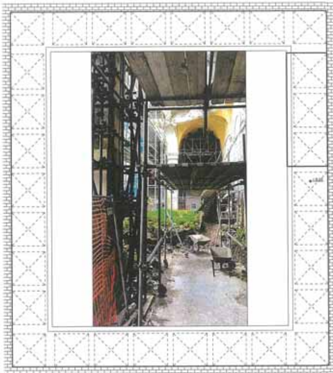
Situazione Attuale della Zona con Volte Crollate