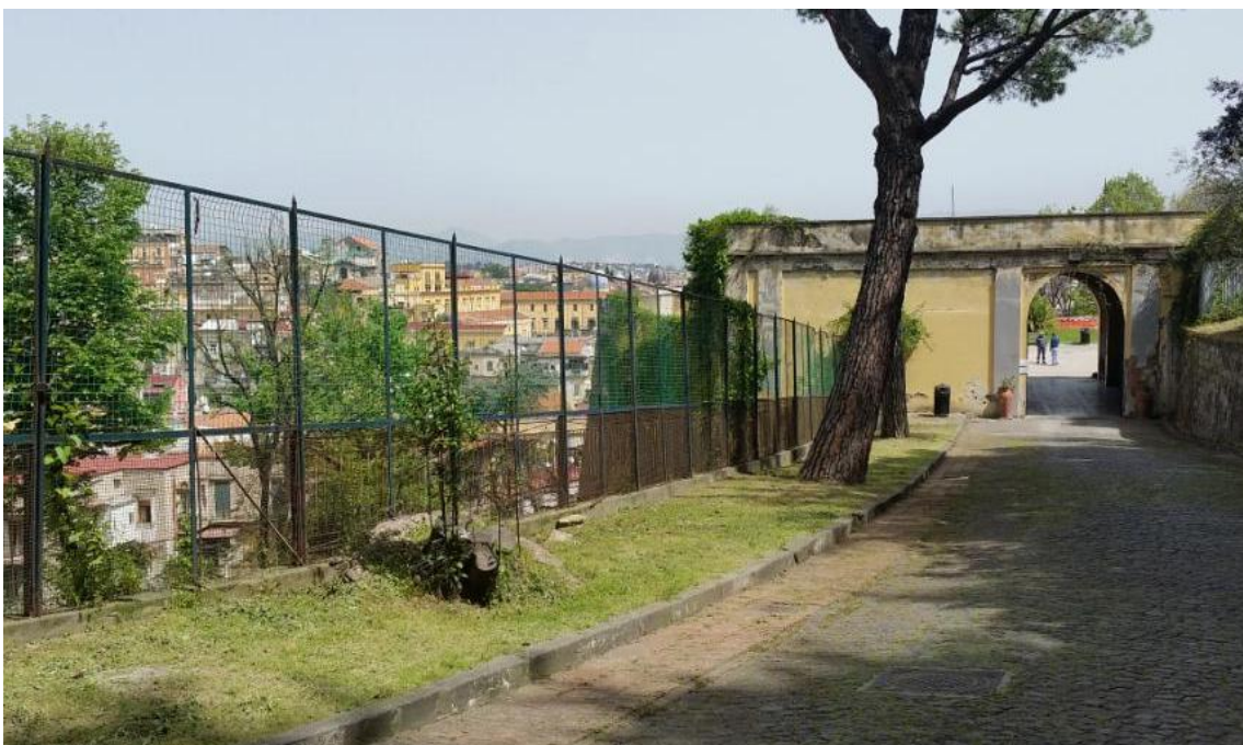
Vista verso l'edificio C1