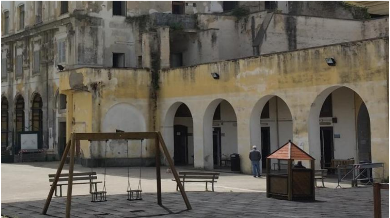
Prospetto porticato prospiciente il giardino superiore