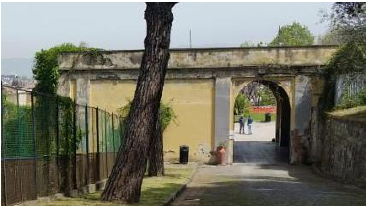
Prospetto dalla rampa di accesso al giardino superiore