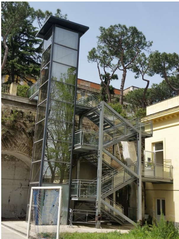
Collegamenti verticali (ascensore e scale) tra i giardini mediano e superiore