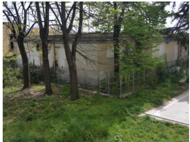
Corpi di fabbrica dell'edificio M che si elevano oltre la quota del giardino mediano: M1 (sul quale si è abbattuto l'albero di tiglio) ed M2 (prospiciente il campo di calcio).