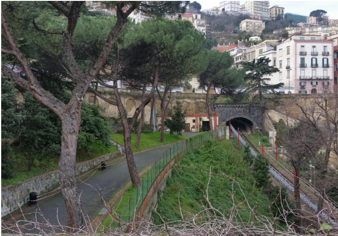
Vista verso l'edificio B ed il muro di contenimento di Corso Vittorio Emanuele