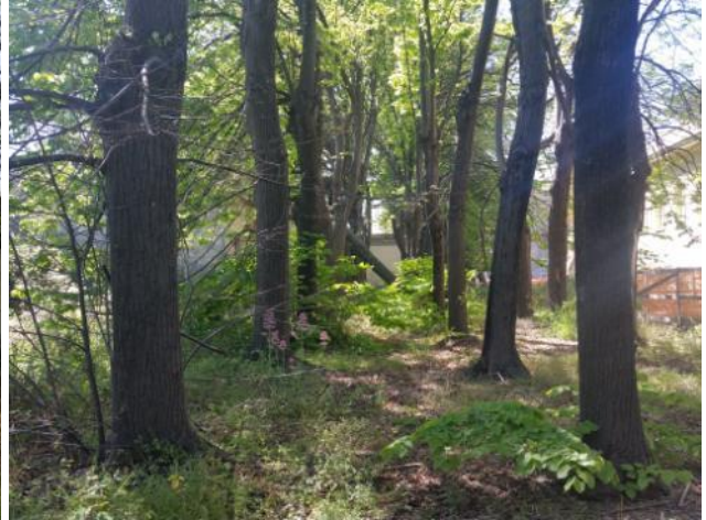
Bosco dei tigli