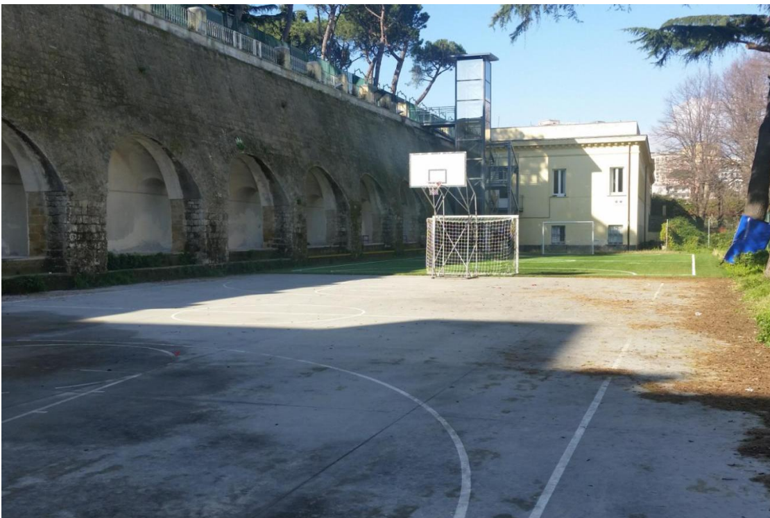
Campetti di calcio e di basket