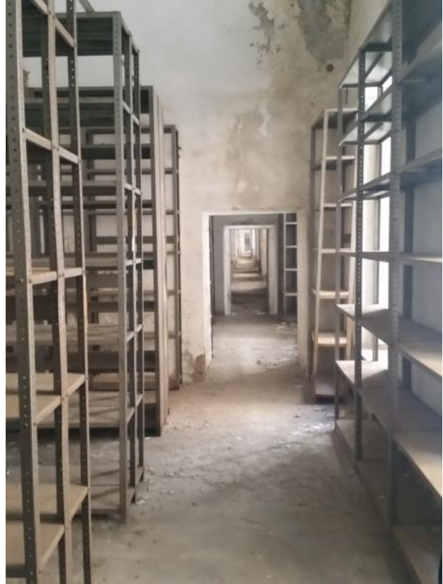
Scala e ambienti interni dell'edificio M.