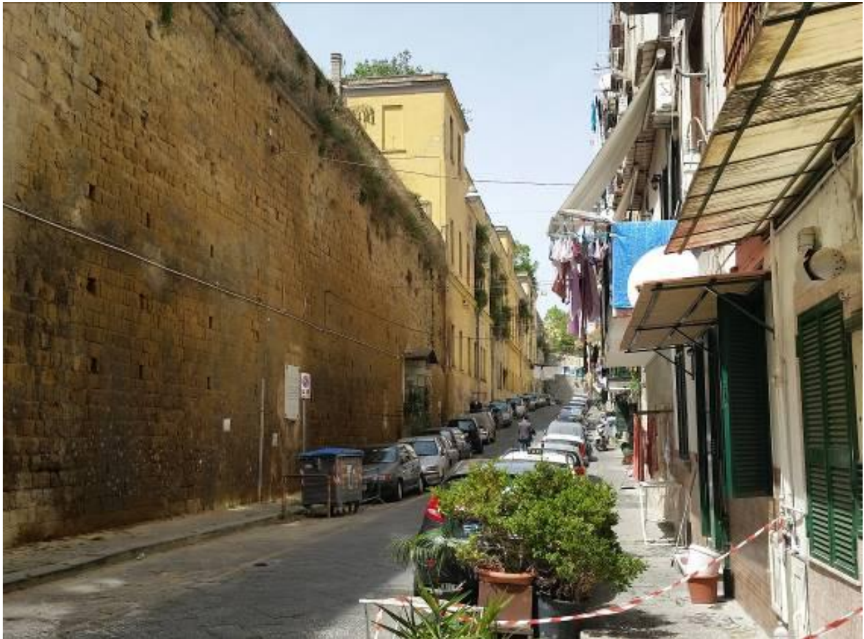
Prospetto prospiciente vico Paradiso