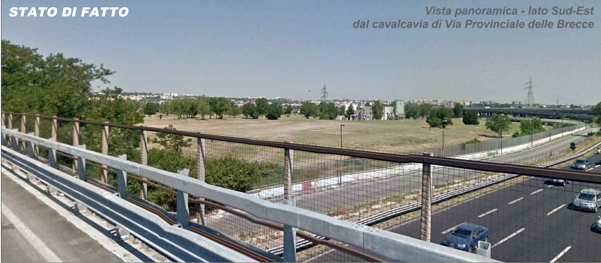
Vista panoramica - lato Sud-Est dal cavalcavia di Via Provinciale delle Brecce