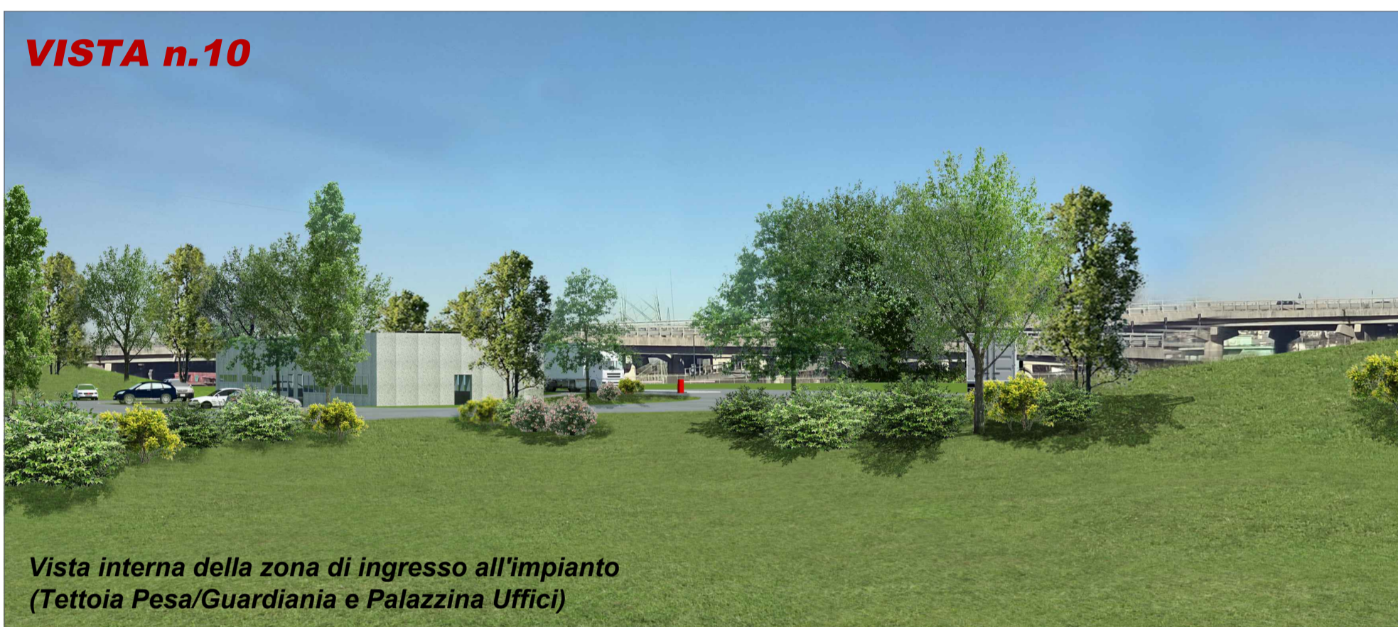
Vista interna della zona di ingresso all'impianto (Tettoia Pesa/Guardiana e Palazzina Uffici)