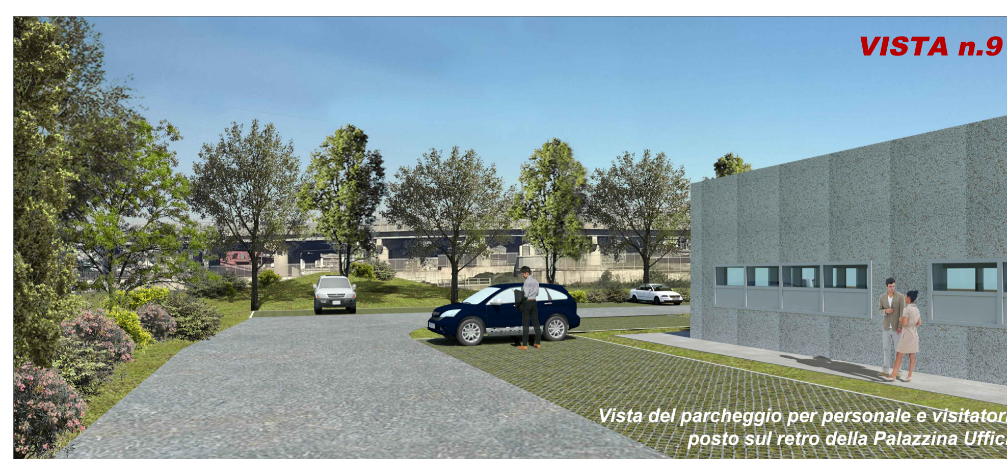
Vista del parcheggio per personale e visitatori posto sul retro della Palazzina Uffici