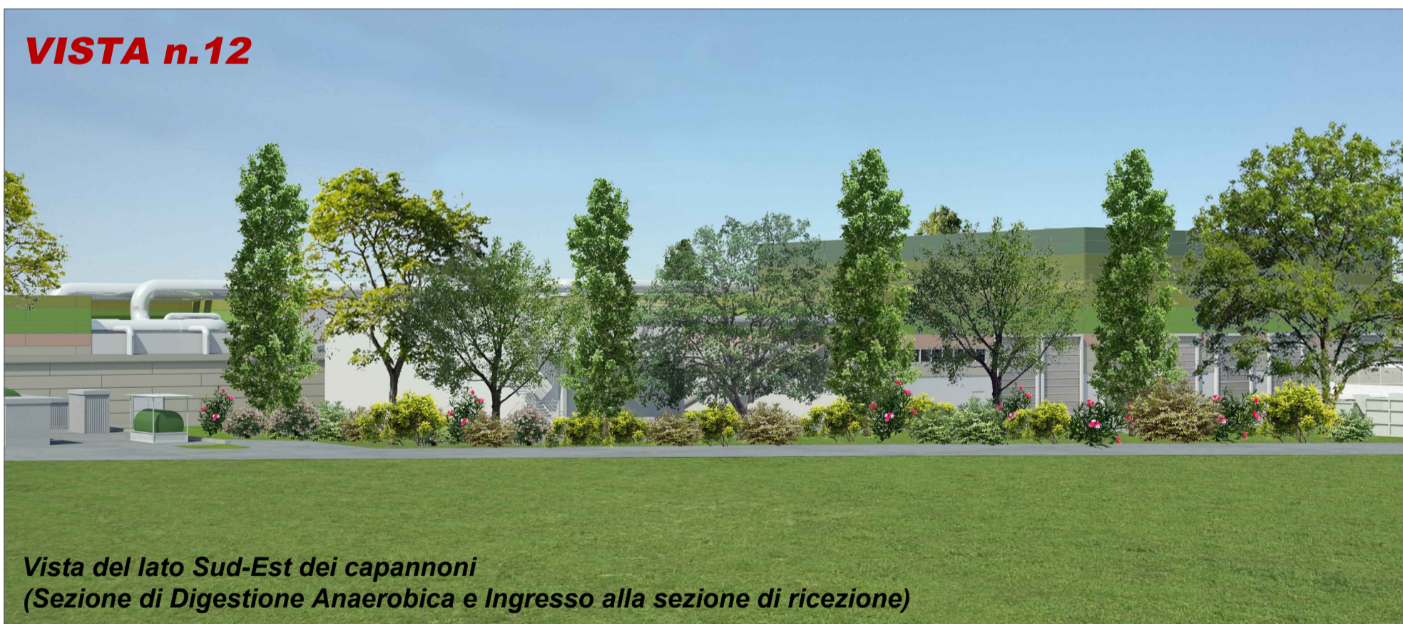
Vista del lato Sud-Est dei capannoni (Sezione di Digestione Anaerobica e Ingresso alla sezione di ricezione)