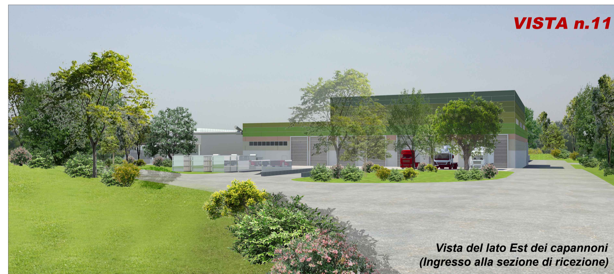
Vista del lato Est dei capannoni (Ingresso alla sezione di ricezione)