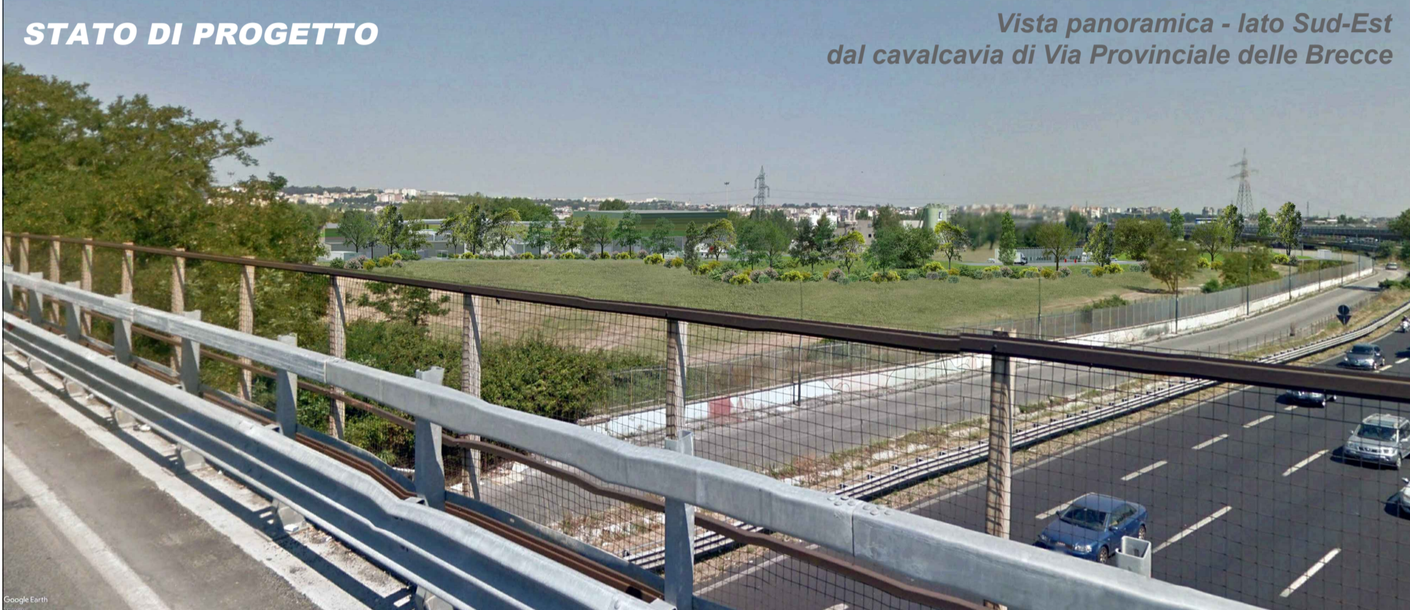
Vista panoramica - lato Sud-Est dal cavalcavia di Via Provinciale delle Brecce