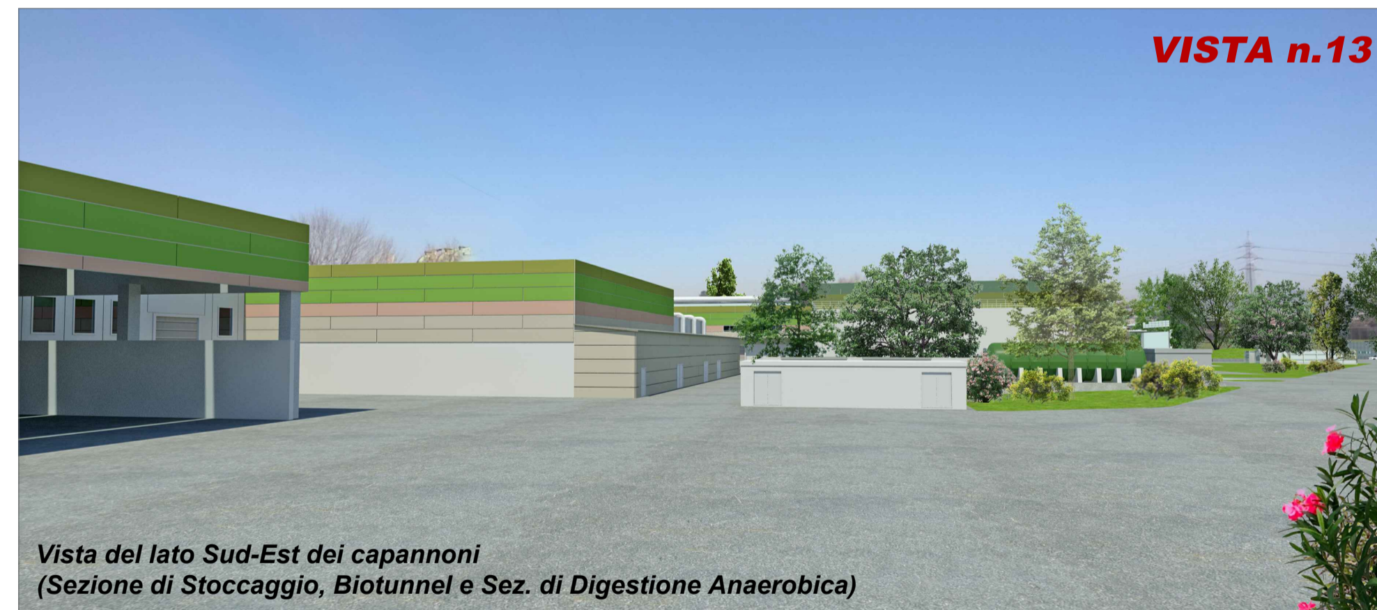
Vista del lato Sud-Est dei capannoni (Sezione di Stoccaggio, Biotunnel e Sez. di Digestione Anaerobica)