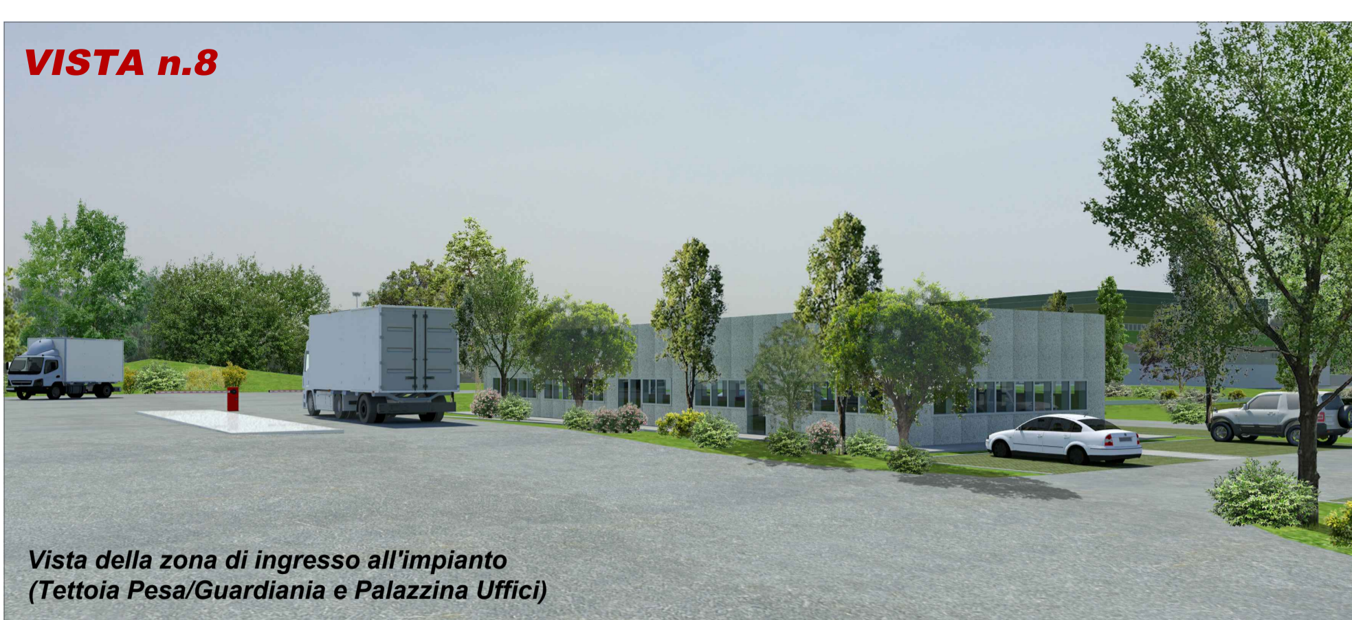
Vista della zona di ingresso all'impianto (Tettoia Pesa/Guardiana e Palazzina Uffici)