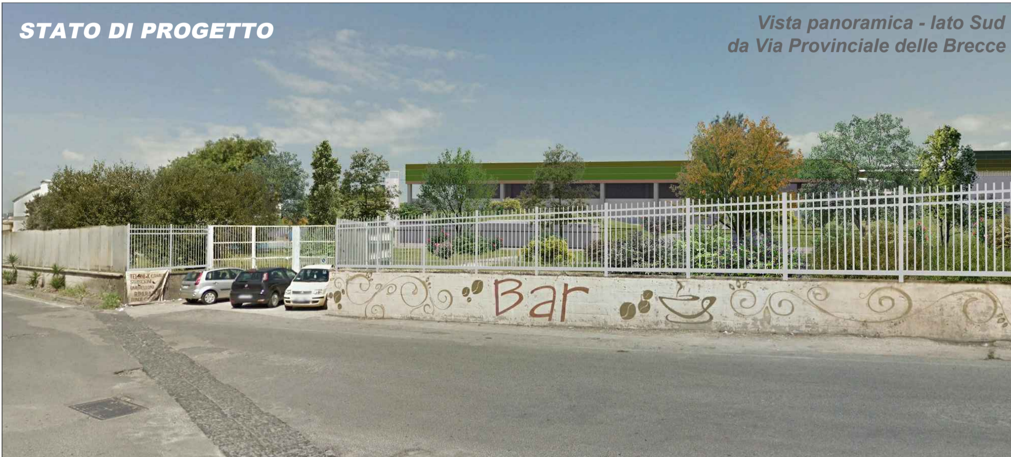
Vista panoramica - lato Sud da Via Provinciale delle Brecce