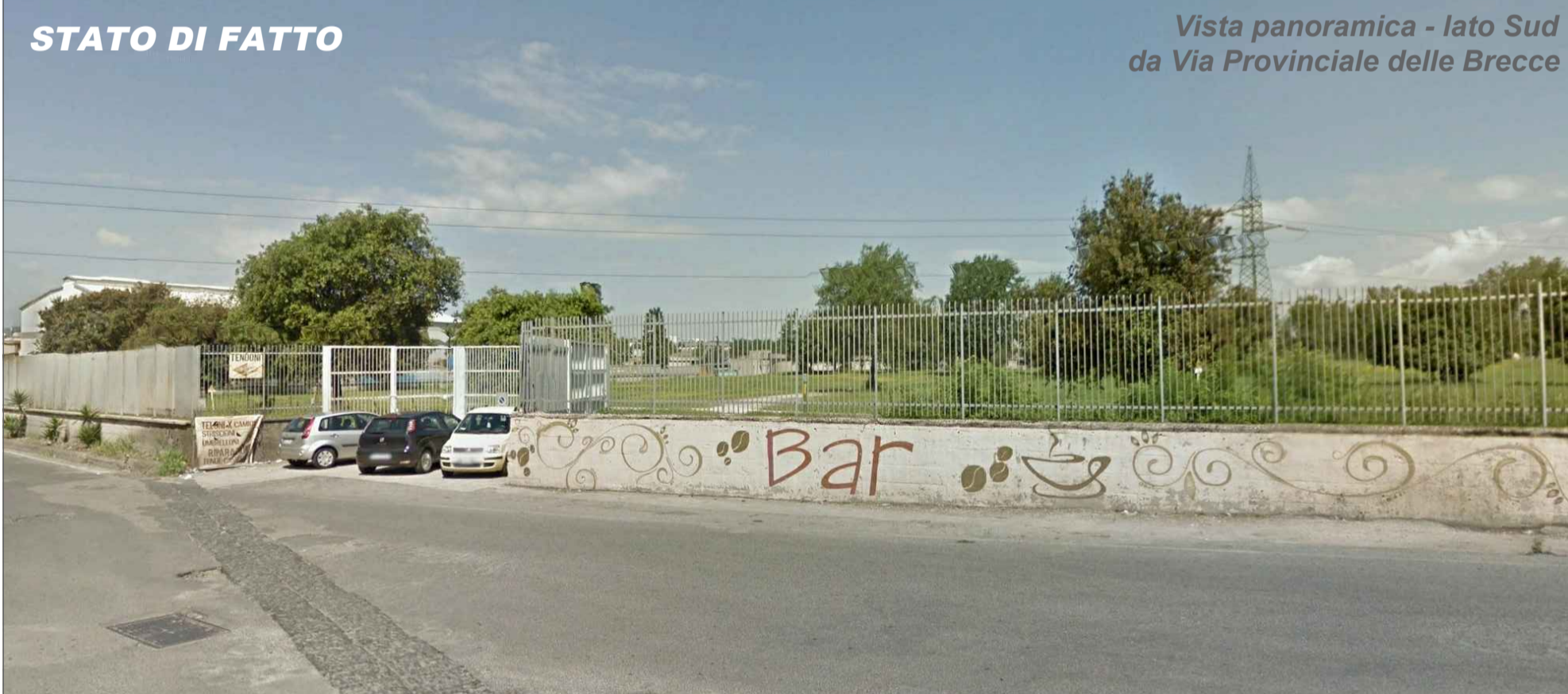
Vista panoramica - lato Sud da Via Provinciale delle Brecce