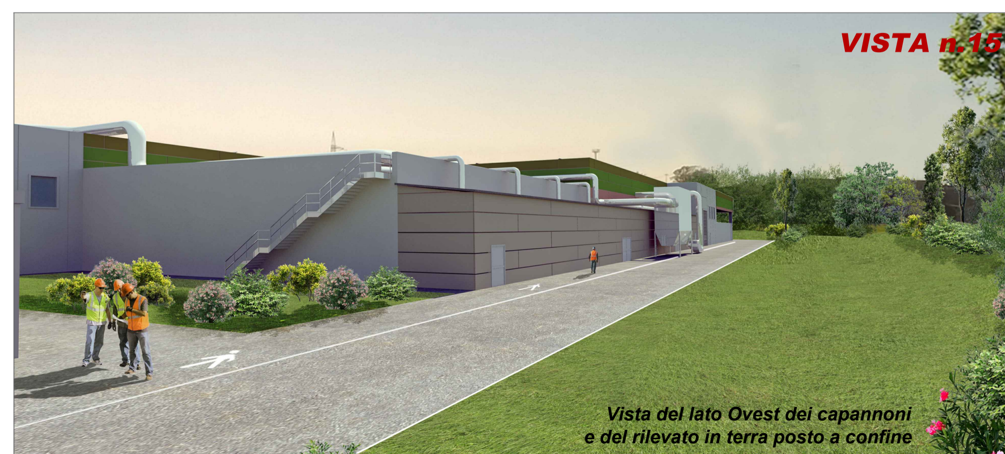
Vista del lato Ovest dei capannoni e del rilevato in terra posto a confine