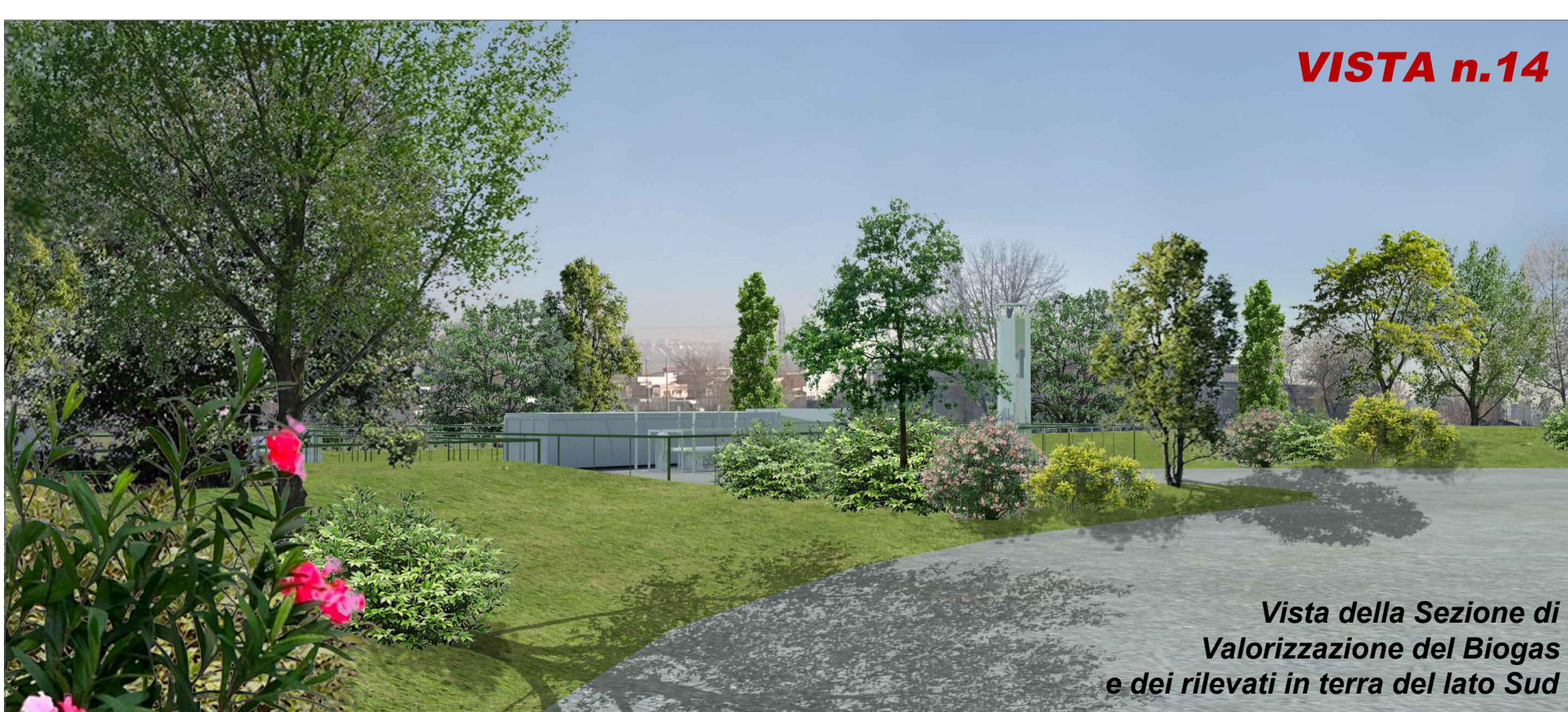
Vista della Sezione di Valorizzazione dei Biogas e dei rilevati in terra del lato Sud