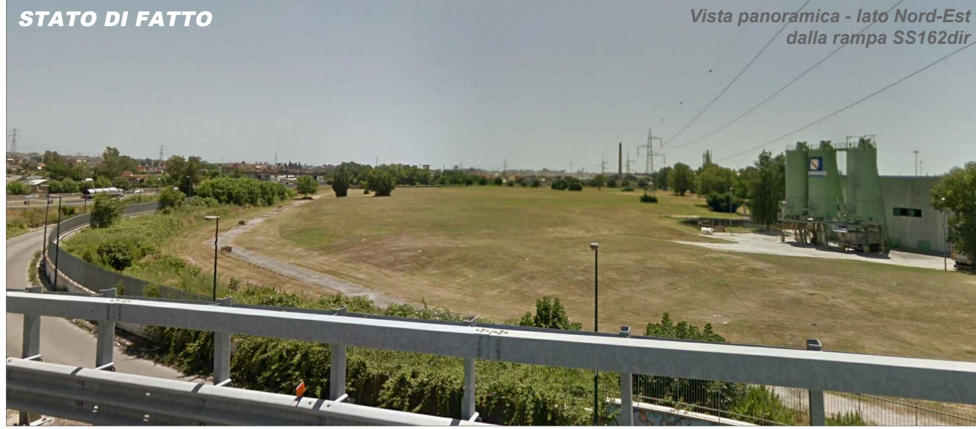
Vista panoramica - lato Nord-Est dalla rampa SS162dir