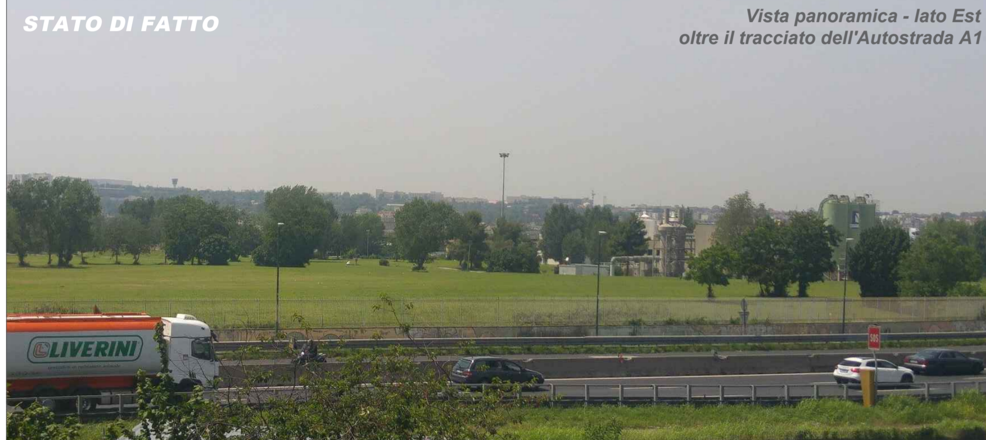
Vista panoramica - lato Est oltre il tracciato dell'Autostrada A1