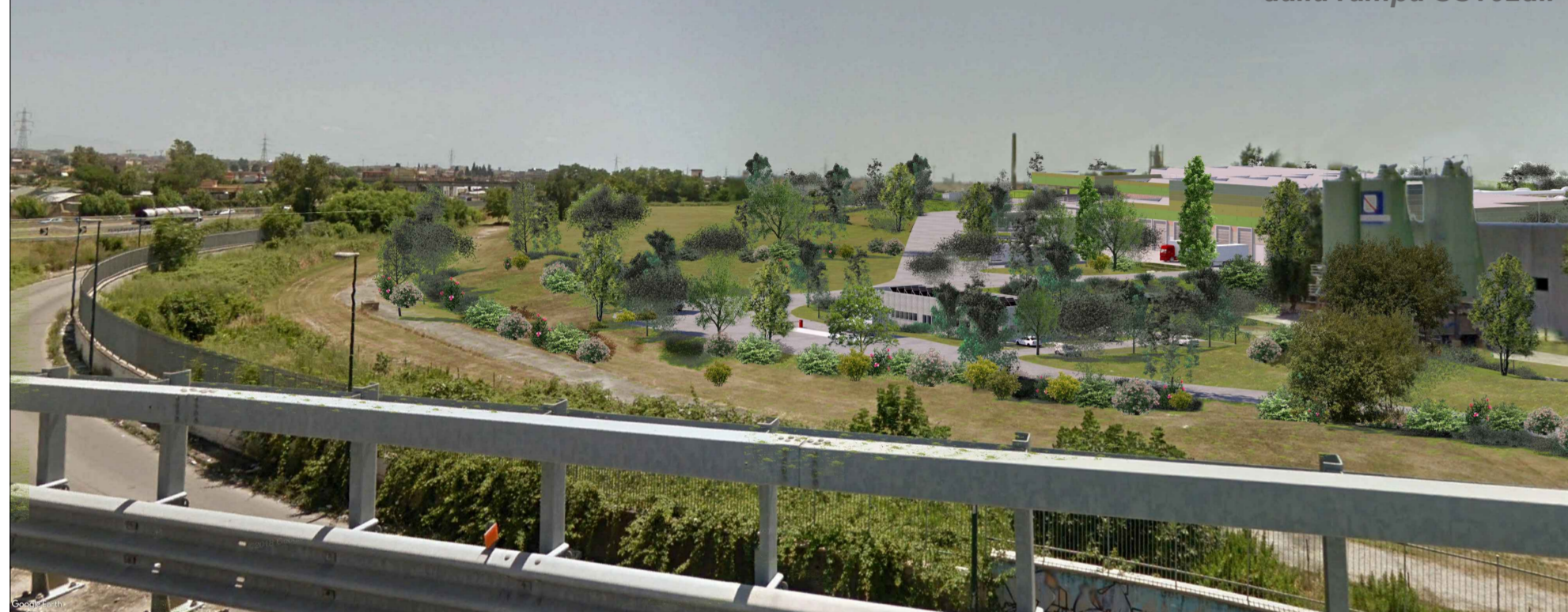
Vista panoramica - lato Nord-Est dalla rampa SS162dir