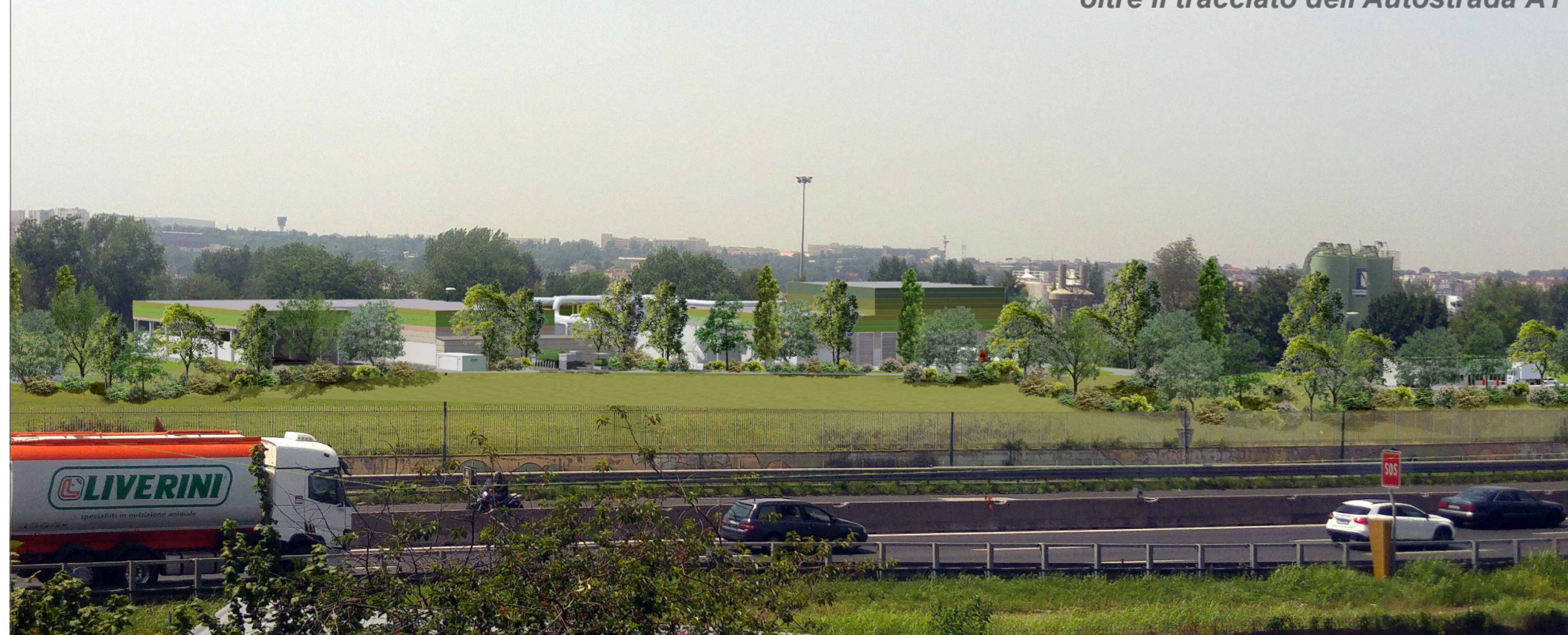
Vista panoramica - lato Est oltre il tracciato dell'Autostrada A1