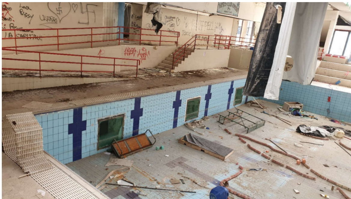
Piscina – vasca adulti