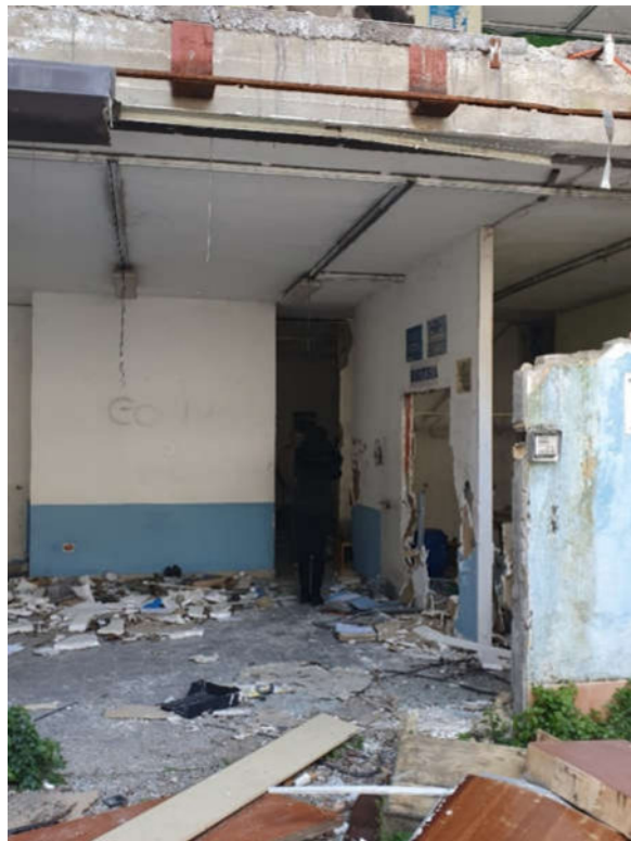
Accesso locali sottovasca