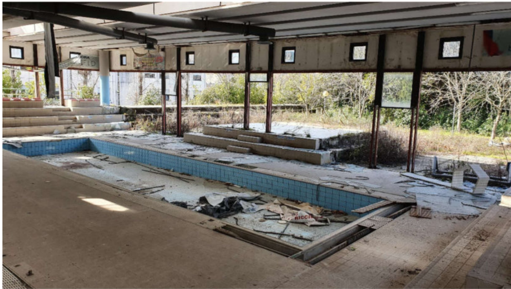
Piscina - vasca bambini