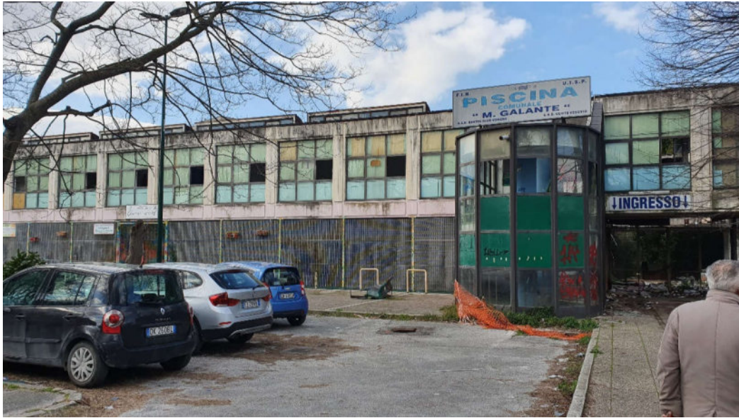
Esterno Ingresso piscina.