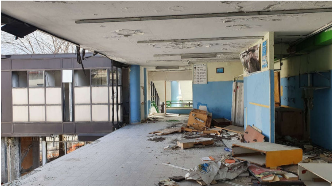
Locali ex bouvette