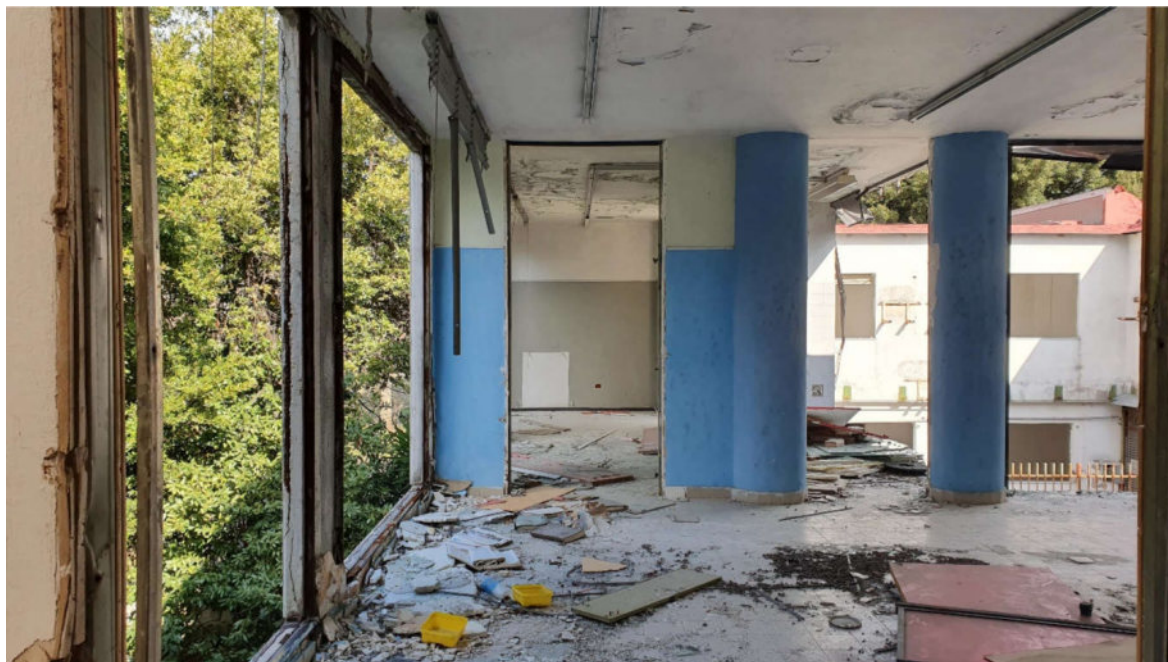
Primo piano. Locali palestre