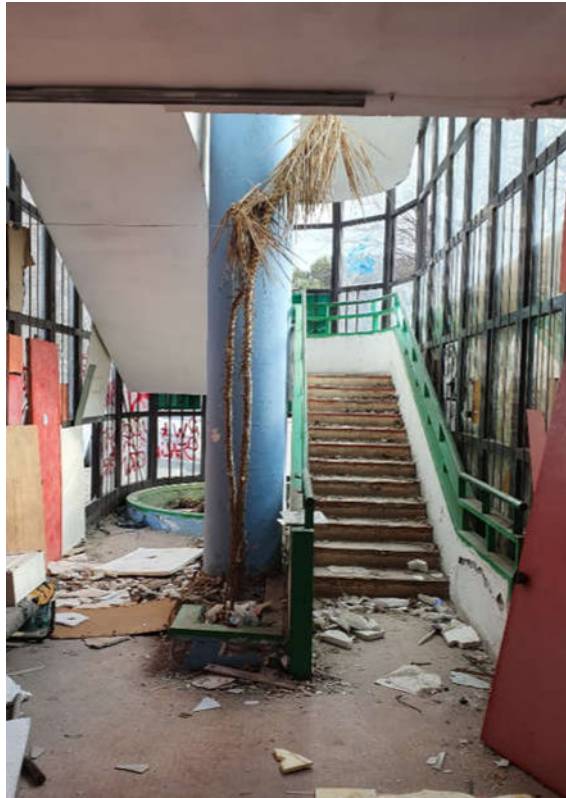
Scala accesso spogliatoi