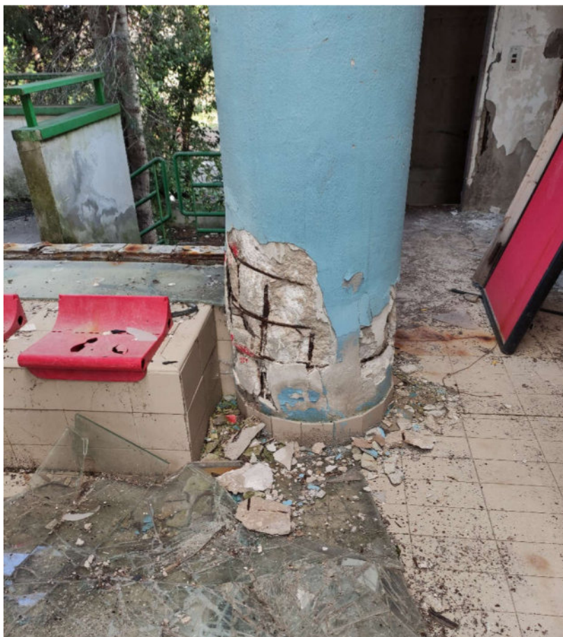
Pilastro sostegno copertura piscina