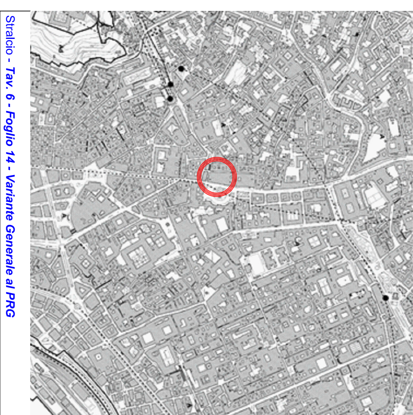
Stralcio - Tav. 6 - Foglio 14 - Variante Generale al PRG