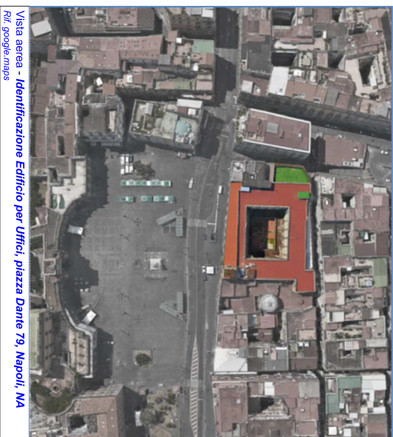
Vista aerea - Identificazione Edificio per Uffici, piazza Dante 79, Napoli, NA Ref. google maps