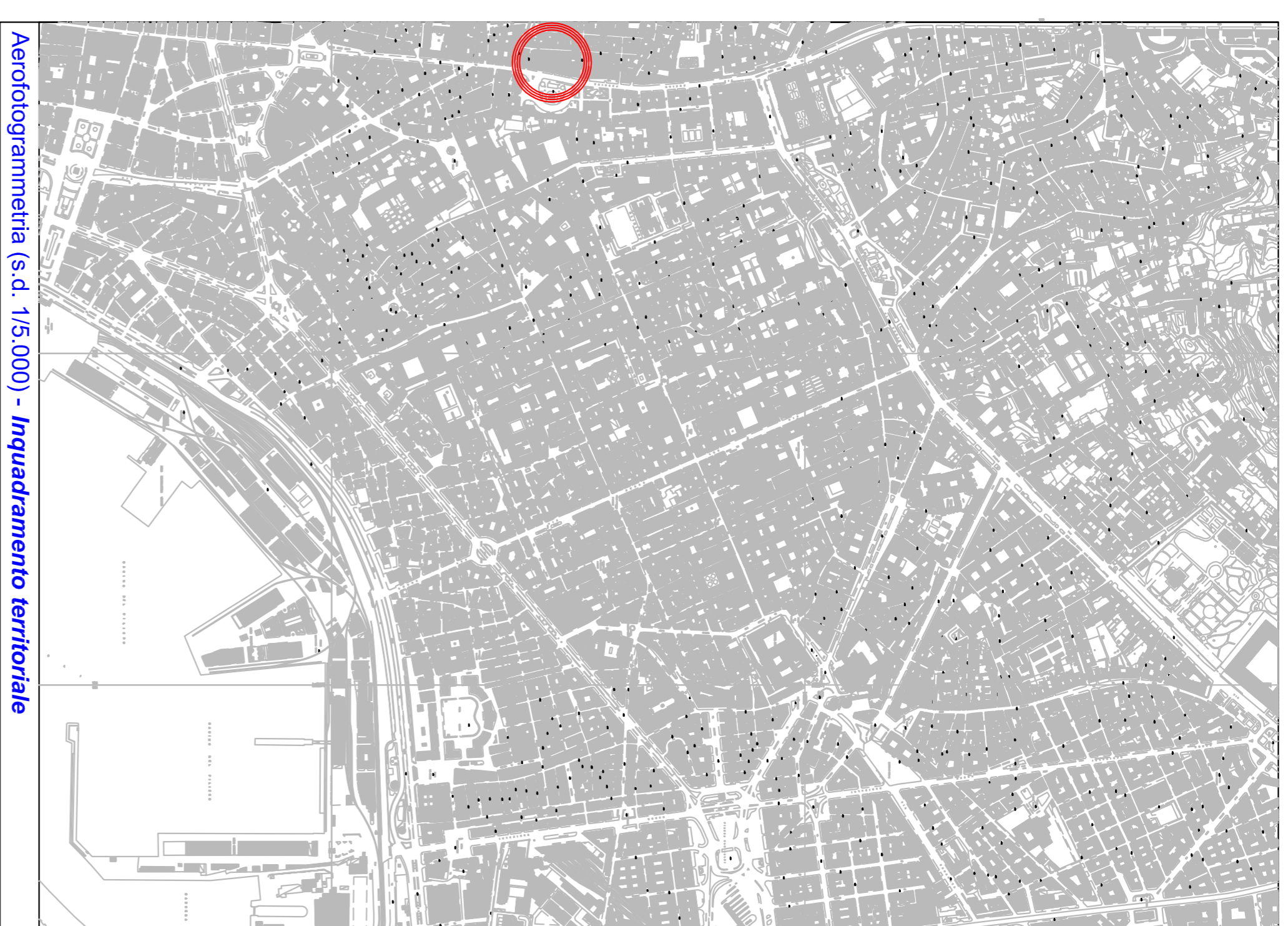
Aerofotogrammetria (s.d. 1/5.000) - Inquadramento territoriale