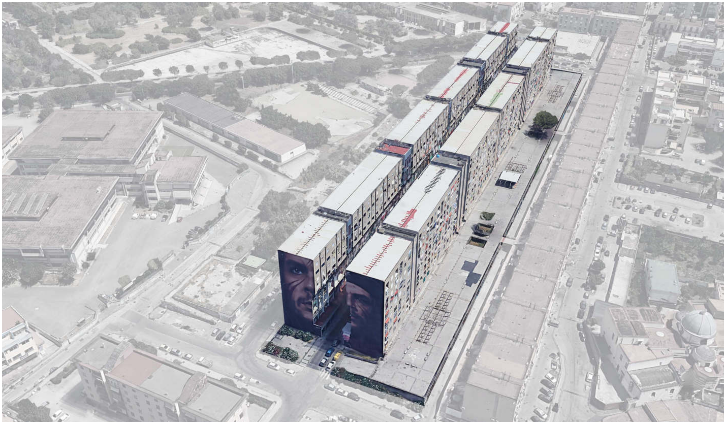
VISTA AEREA DA NORD OVEST