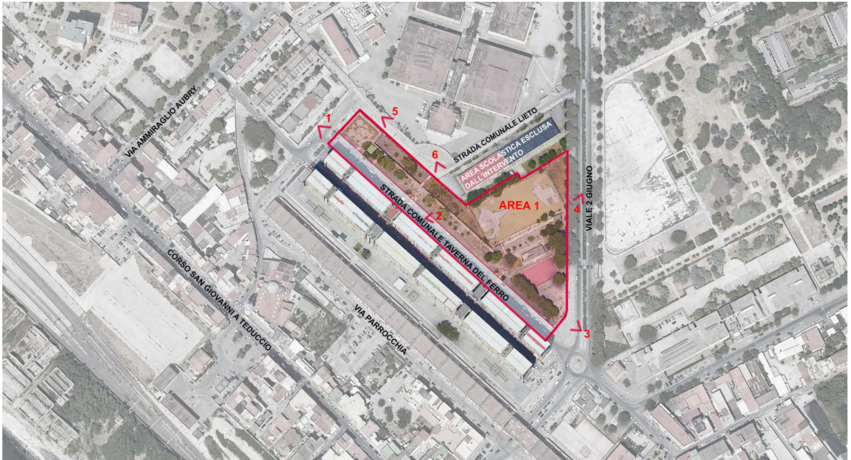
ORTOFOTO CON INDICAZIONE DEI CONI OTTICI