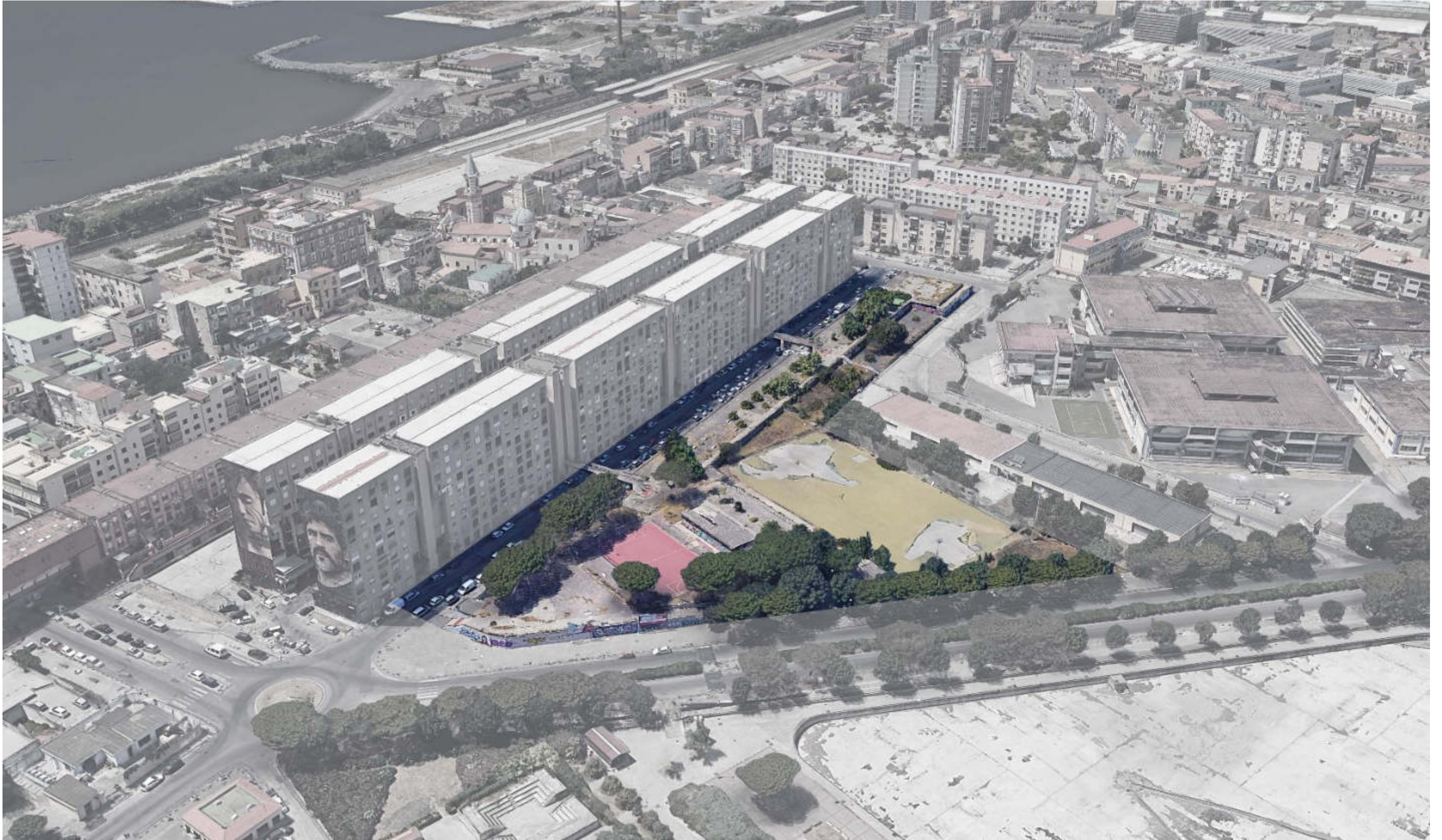
VISTA AEREA DA NORD EST