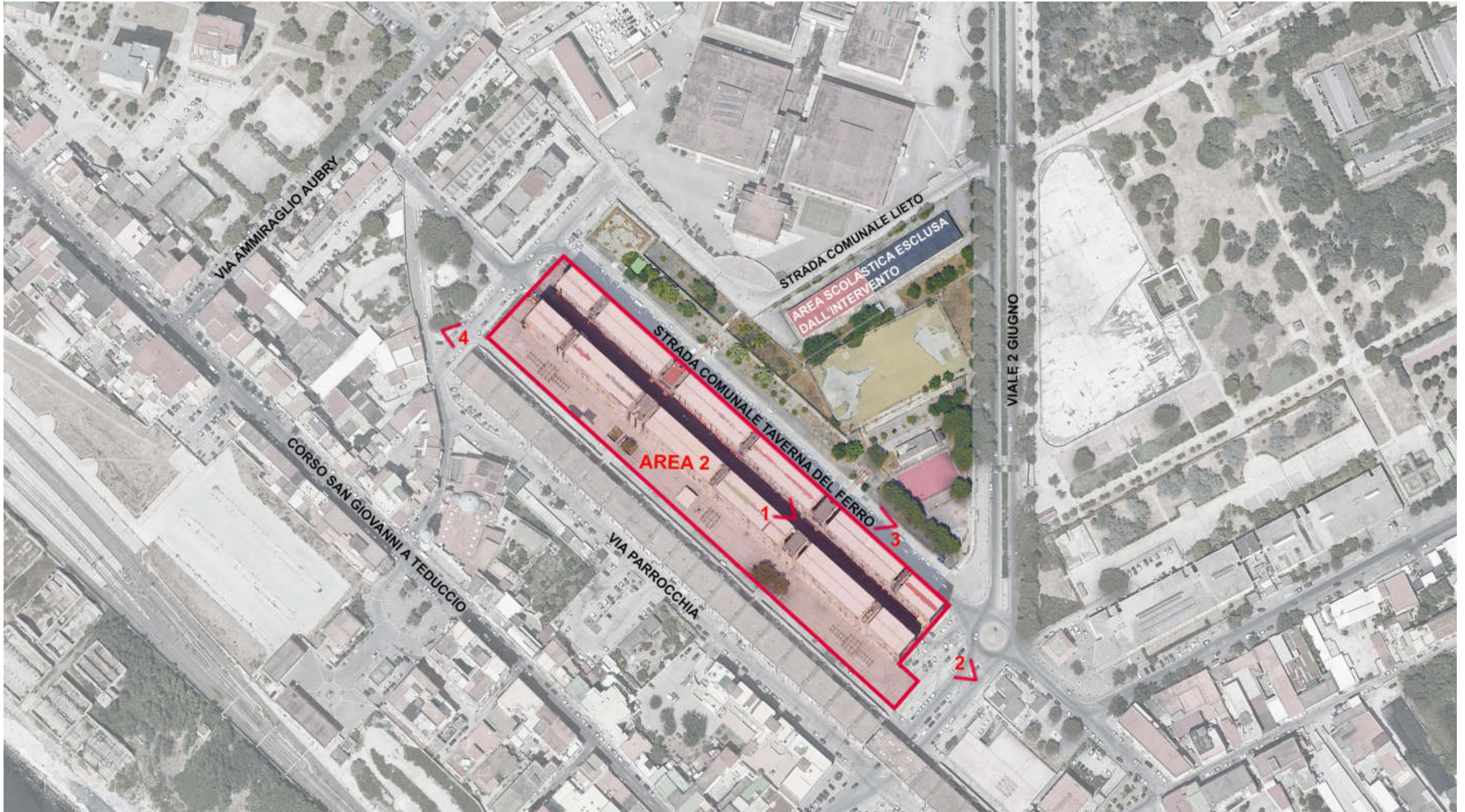
ORTOFOTO CON INDICAZIONE DEI CONI OTTICI