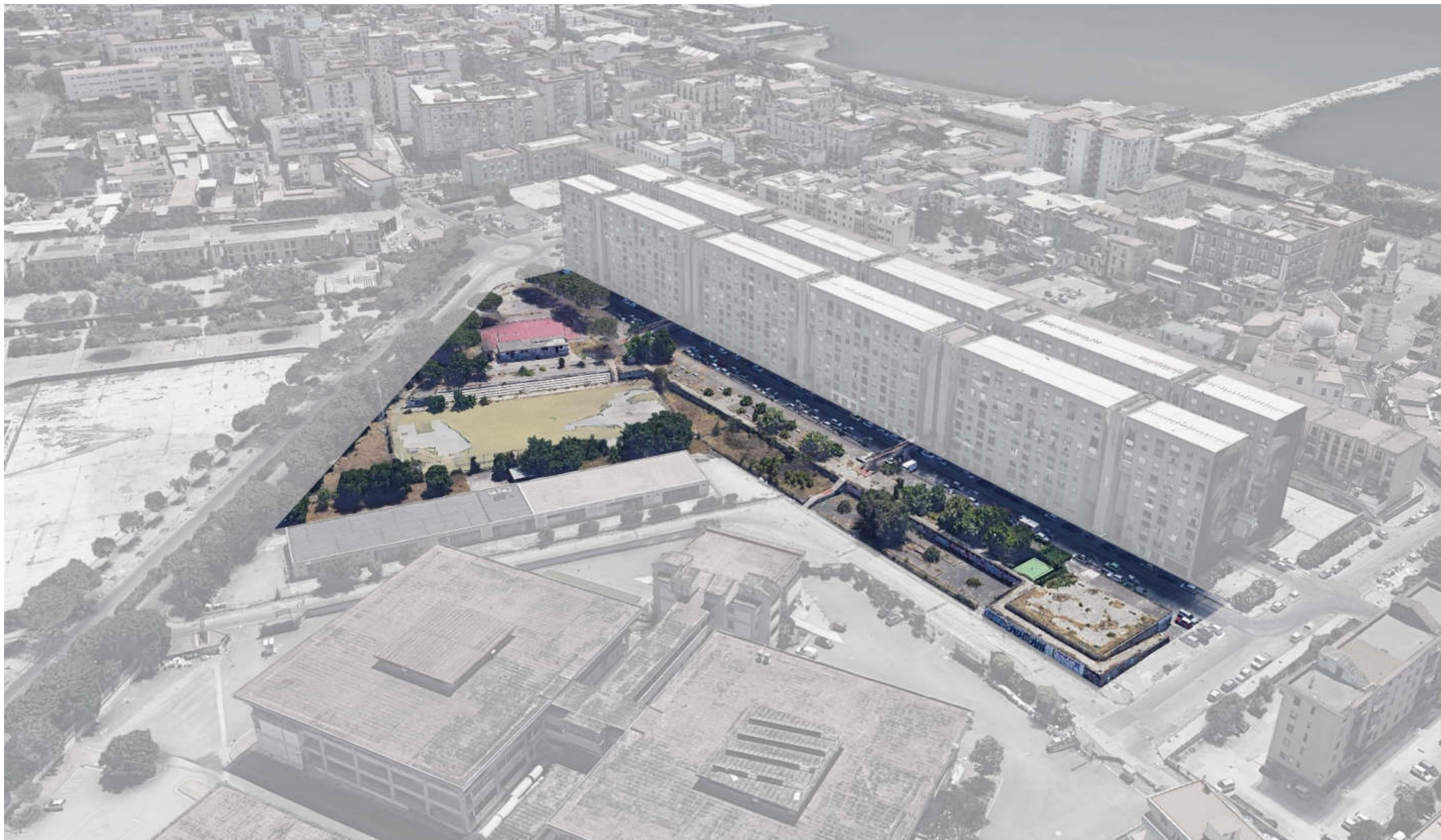
VISTA AEREA DA NORD OVEST