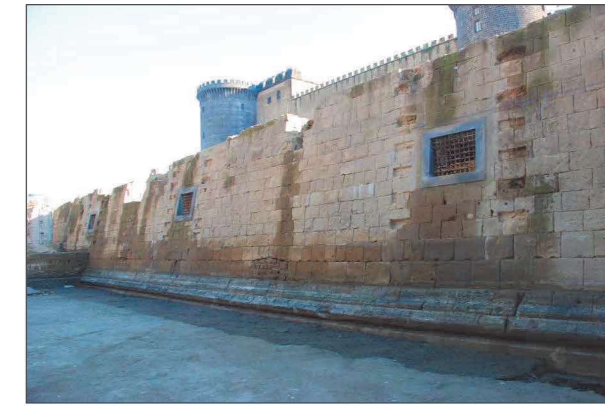
Fig. 9 La cinta di età vicereale.