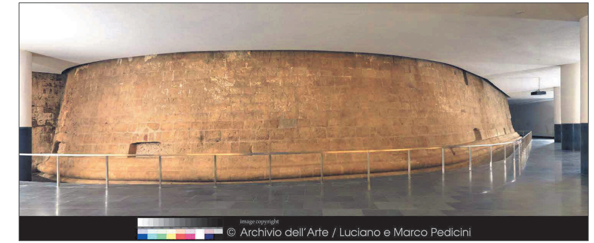
Fig. 10 Il torrione dell'Incoronata restaurato nella stazione Municipio.