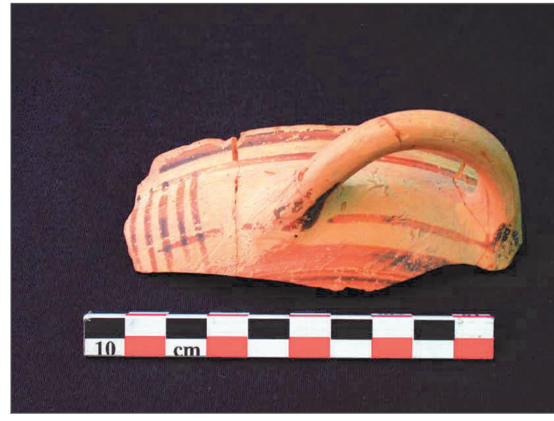
Fig. 1 Skyphos . seconda metà VIII secolo a. C.