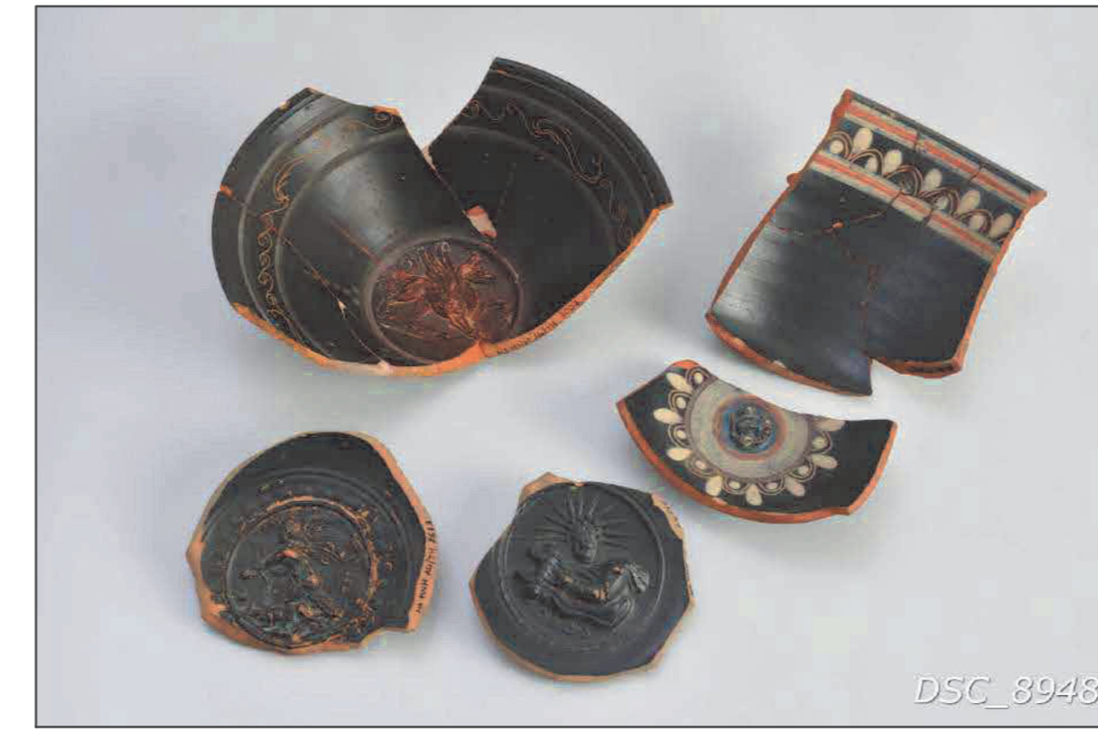
Fig. 3 Ceramica di età ellenistica.