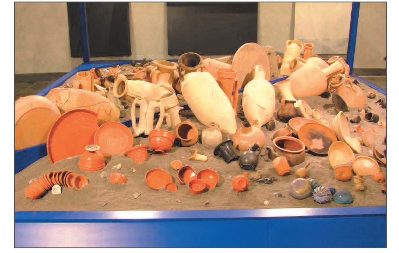
Fig. 6 L'allestimento delle ceramiche dal porto di età imperiale.