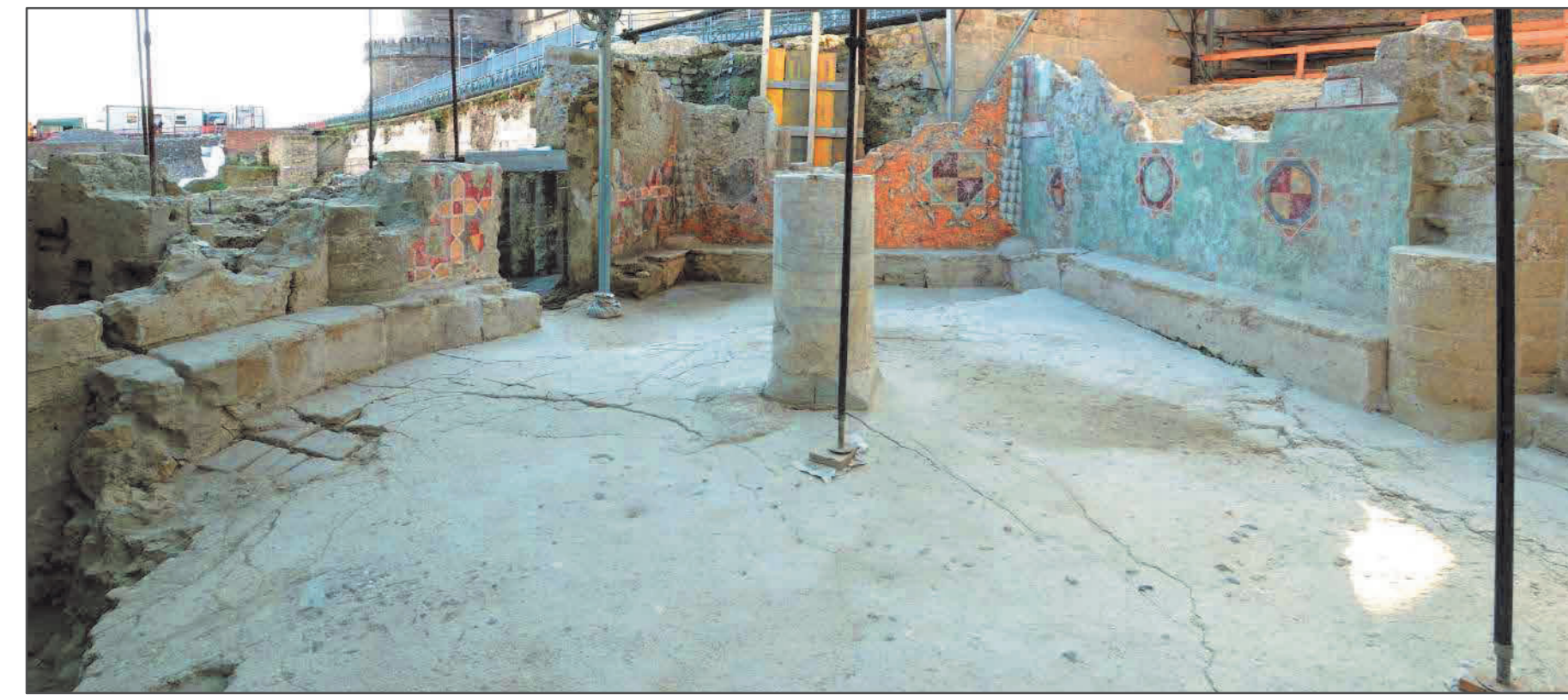
Fig. 7 La residenza affrescata di età angioina.