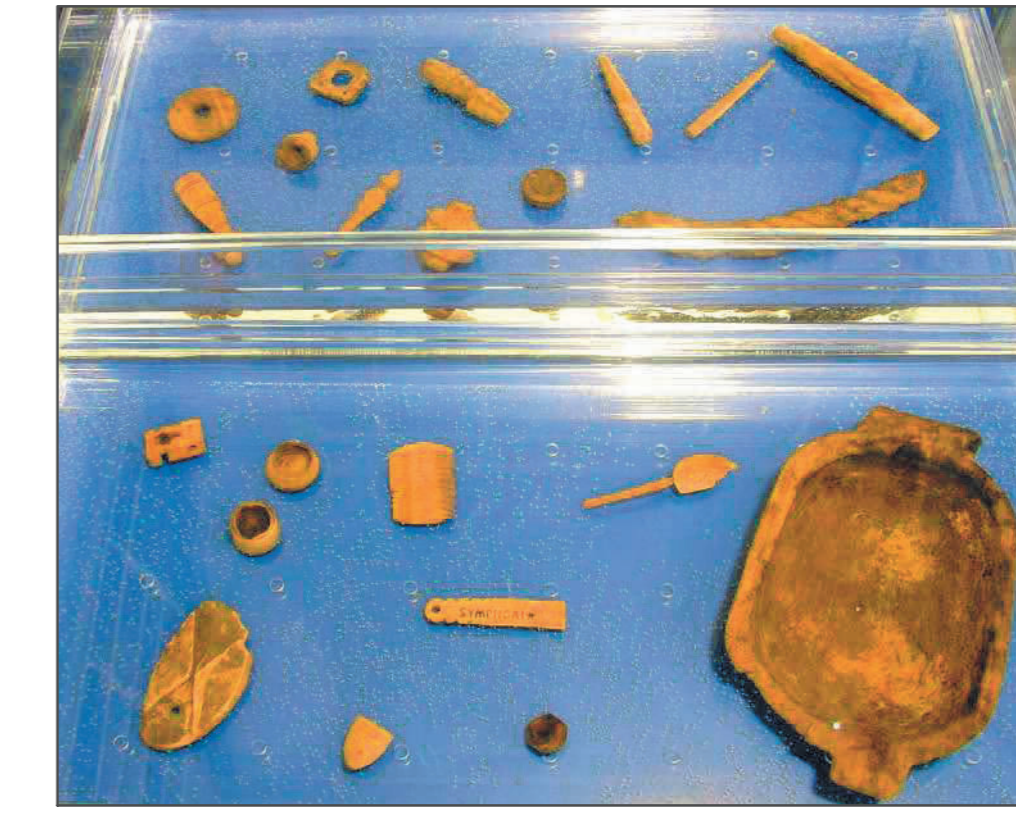
Fig. 5 Piccoli reperti organici dal porto di età imperiale.