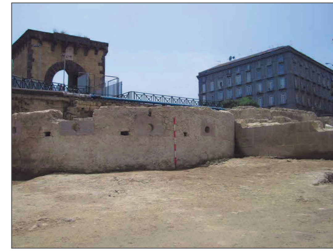
Fig. 8 La cittadella aragonese.