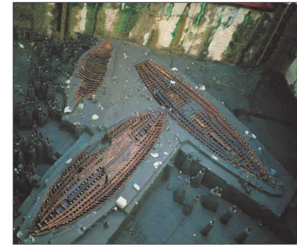
Fig. 4 I grandi relitti dal porto di età imperiale.