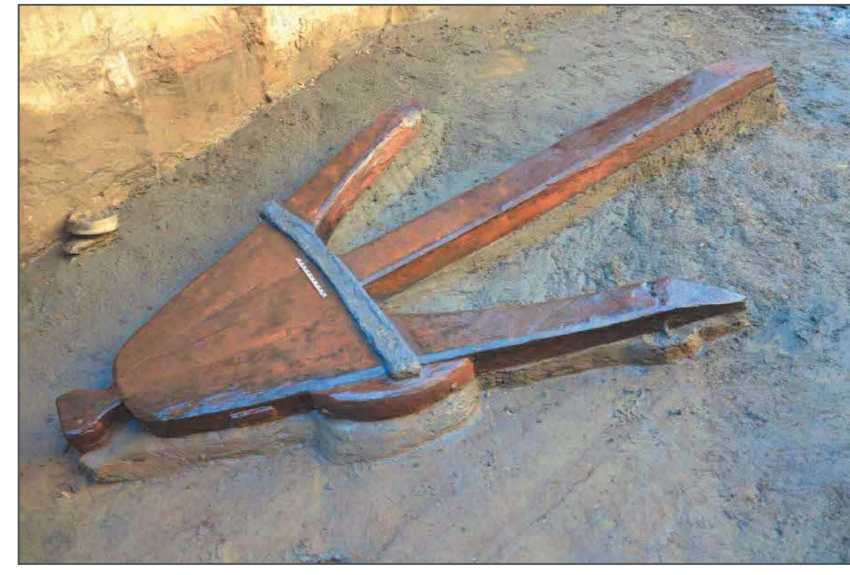
Fig. 2 Ancora lignea. II secolo a. C.