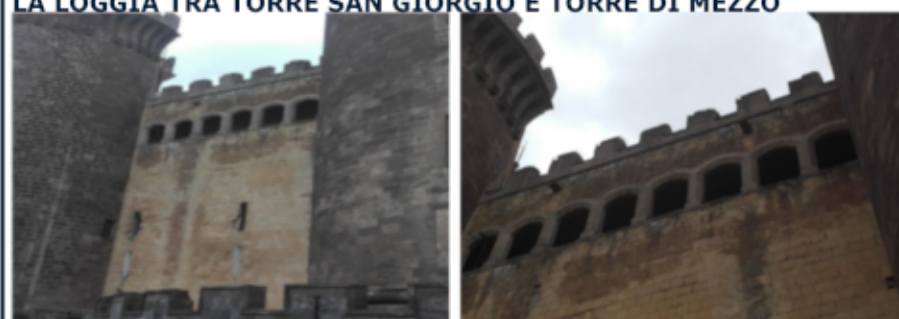
INTERVENTO N°07 INTERVENTO SULLA MURATURA IN TUFO ESTERNA LATERALE DELLA CAPPELLA PALATINA, SULL'INTONACO DEL TERRAZZO SOTTOSTANTE E SULLE LOGGE VIA ACTON