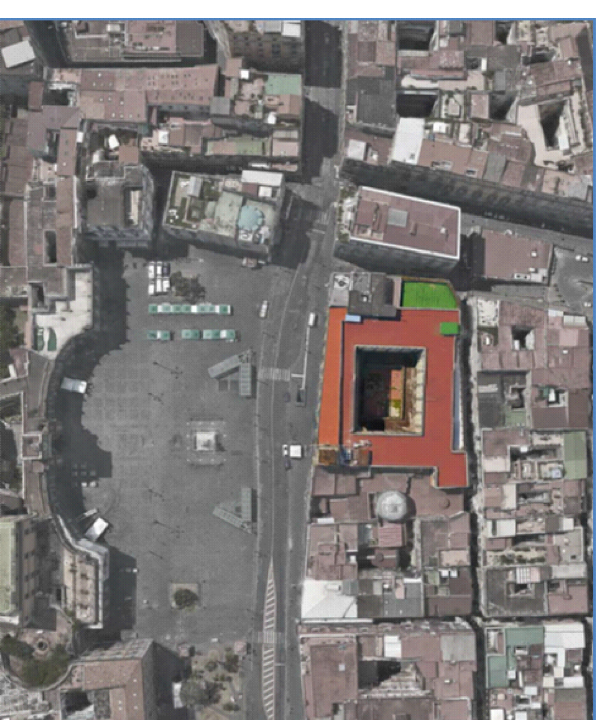
Vista aerea - Identificazione Edificio per Uffici, piazza Dante 79, Napoli, NA