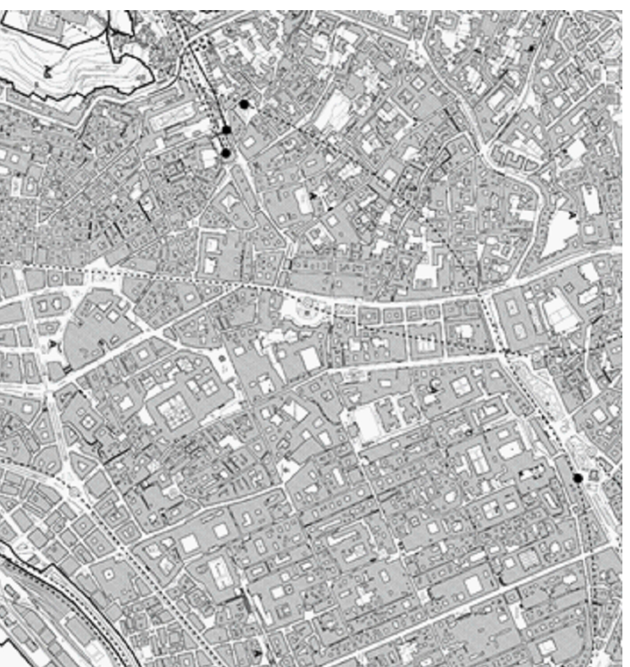
Stralcio - Tav. 6 - Foglio 14 - Variante Generale al PRG