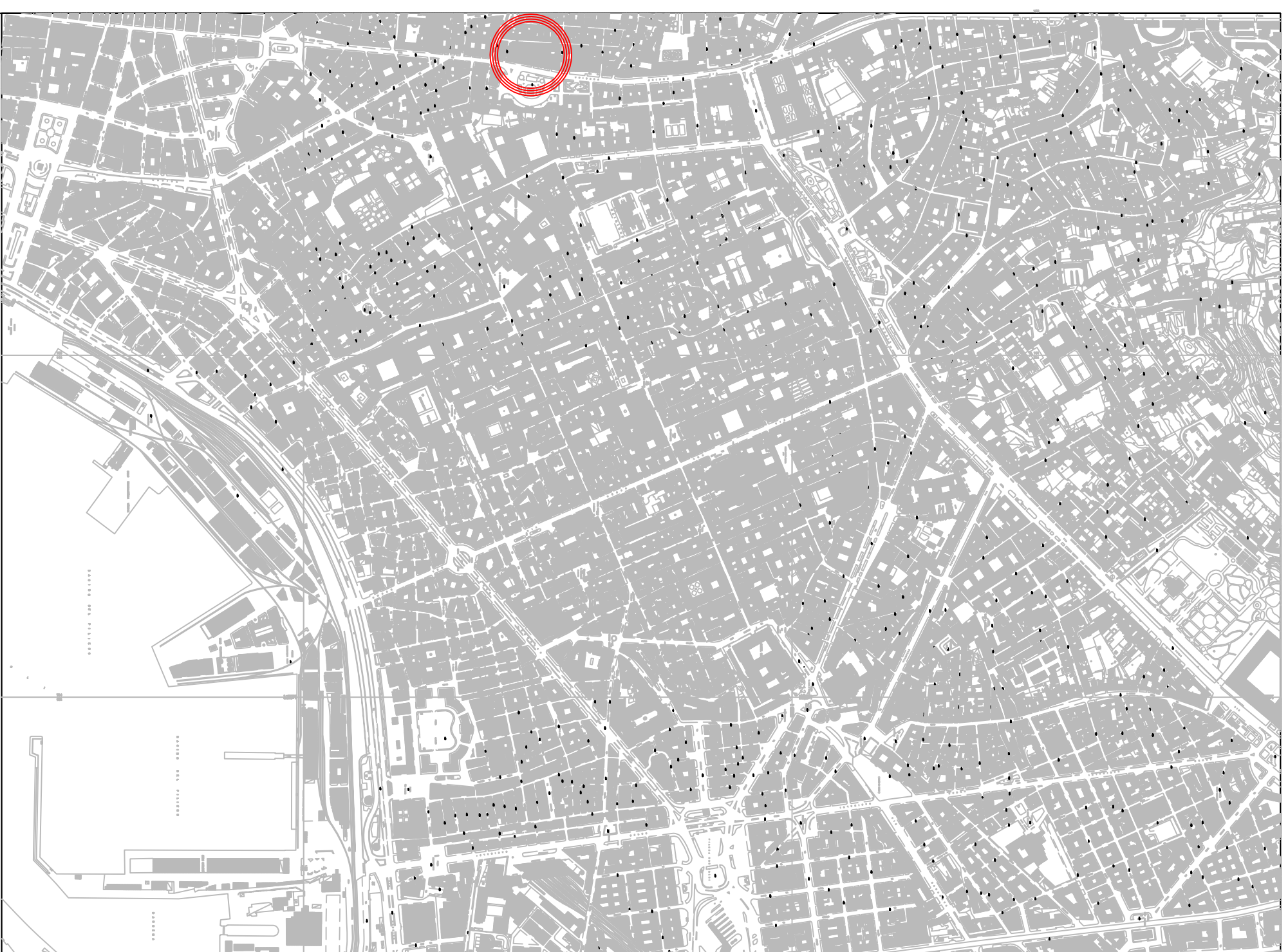
Aerofotogrammetria (s.d. 1/5.000) - Inquadramento territoriale